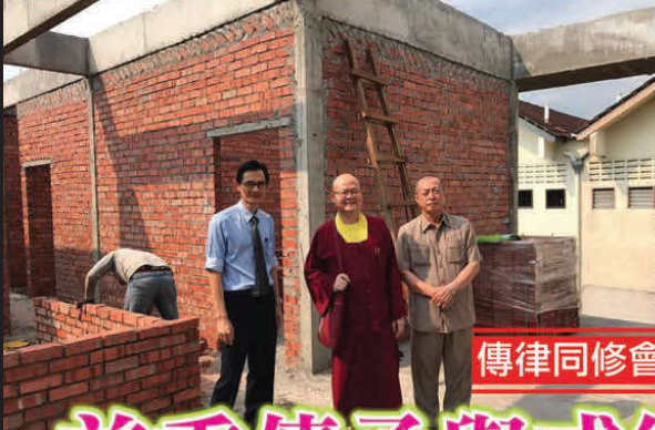
傳律同修會·建寺訪談