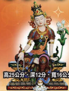
高25公分、深12分、寬16公分