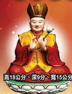
高18公分、深9分、寬15公分