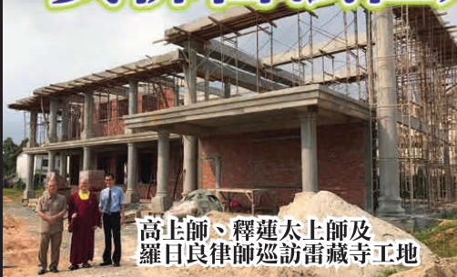
高上師、釋蓮太上師及羅日良律師巡訪雷藏寺工地