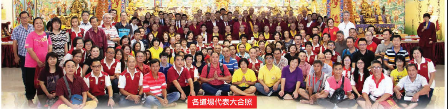
各道場代表大合照

2017年6月18日下午1時，馬來西亞真佛宗密教總會第7屆2017年度常年會員代表大會於般若雷藏寺圓滿舉行。