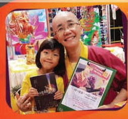
這小女孩發願一日一文章，才6歲；她告訴媽媽她要發願，請媽媽每天念一遍文章給她聽，所以她也帶動媽媽一起發願。

让你我一起，以行动展示力量，点击发愿【一日一文章】： http://one.tbsn.my