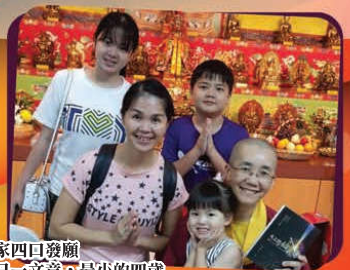
一家四口發願一日一文章，最小的四歲