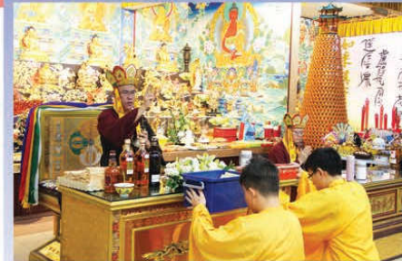
上師加持報名表格