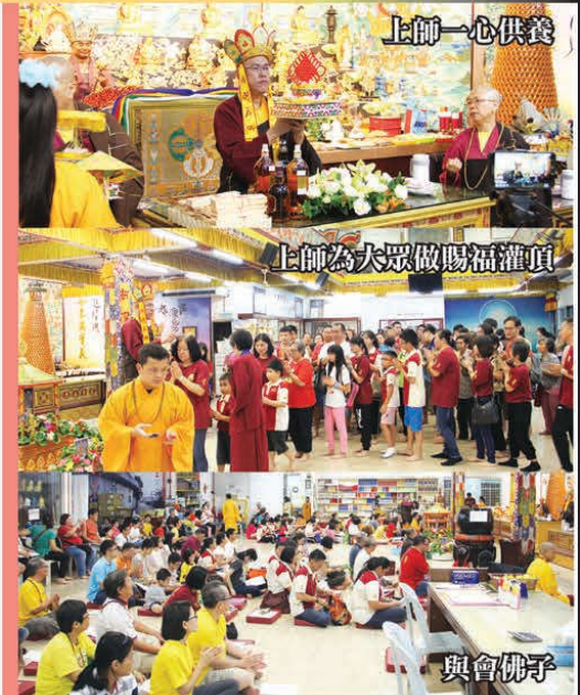
灌頂，一个清凉的法流在你心上，不要怕吃亏，因为这种吃亏会让你有更多成就的资粮。

虽然不容易，要忍让一个人，由他，忍他，让他，由他，避他，奈他，敬他，不理他，当然当下的“无明”是真的很难过，所以也要去向这方面去学习，若干年后，心境也会不同。简单几句话，好比醍醐