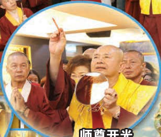
师尊开光加持坛城