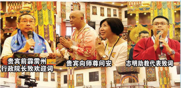
贵宾前霹靂州 行政院长致欢迎词