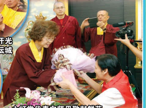
心灯堂代表向师母敬献鲜花