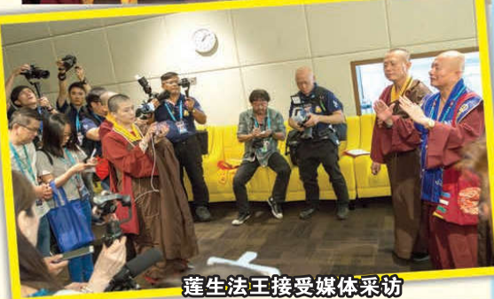
莲生法王接受媒体采访