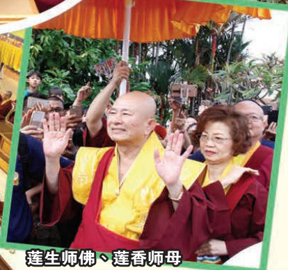
蓮生師佛、蓮香師母

期许般若雷藏寺必须带头，学习佛陀所教的佛法，让这个法船，到达摩诃双莲池的彼岸，「最重要的就是你本身有信仰如来的心，信仰佛陀的心」。更进一步，师尊阐释，从凡夫的身一直到达如来的果位的过程，就叫做大幻化网金刚的修行法。因此，在修行的过程中，其他的节枝节枝都不重要，譬如神通，能够跟所有的动物、飞禽、走兽，甚至蚂蚁、蜘蛛、苍蝇讲话，跟成佛毫无关联。