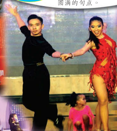
国标舞掀起晚宴高潮