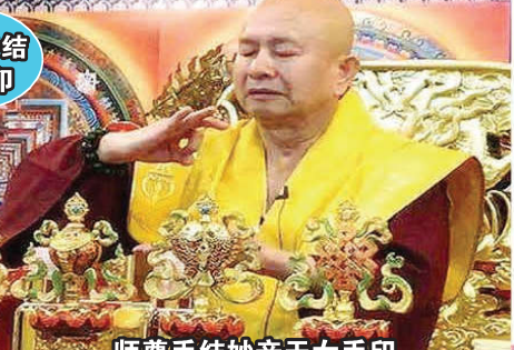
师尊手结妙音天女手印

【梅茵／马来西亚吉隆坡报导】继人潮汹涌的怡保雷藏寺后，莲生师佛卢胜彦于2017年12月17日下午，佛驾「妙音雷藏寺」进行开光加持仪式，傍晚5点左右，天空下起雨来了，越下越大，莲生师佛一行在这风雨飘飘中，抵达妙音雷藏寺主持开光大典。莲生师佛开示说，这次大幻化网金刚法会，可以说真佛宗过去的上师，全部聚集在虚空，像莲翰、印尼丁上师、尤上师、莲噶、莲信、莲花益民、莲品上师都到了！最高的已经成了华光佛，最低已经成为地神，还有的在地狱，他们希望借由大幻化网金刚，能破地狱，把他们从地狱解救出来。这次的法会非常殊胜成功。