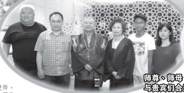
师尊、师母 与贵宾们合影

首先，我们敬礼传法祖师，敬礼了鸣和尚，敬礼萨迦证空上师，敬礼十六世大宝法王噶玛巴，敬礼吐登达尓吉上师，敬礼今天法会的主尊「阿达尔玛佛化身的大幻化网金刚」，敬礼坛城三宝，敬礼诸佛、菩萨、金刚、护法、空行、诸天。