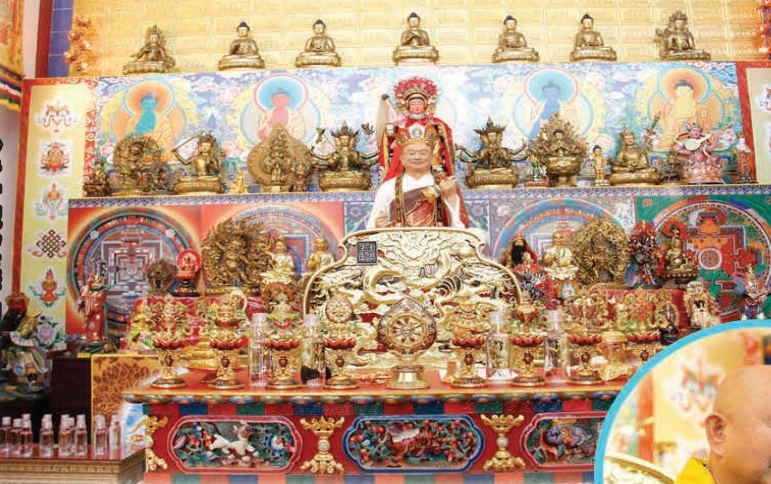
妙音雷藏寺庄严的坛城