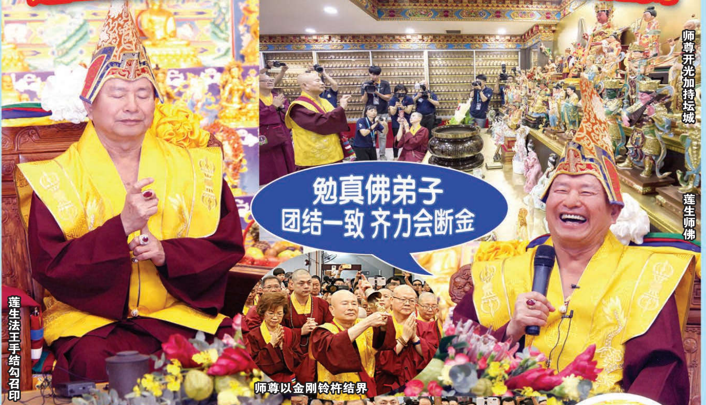
师尊开光加持坛城