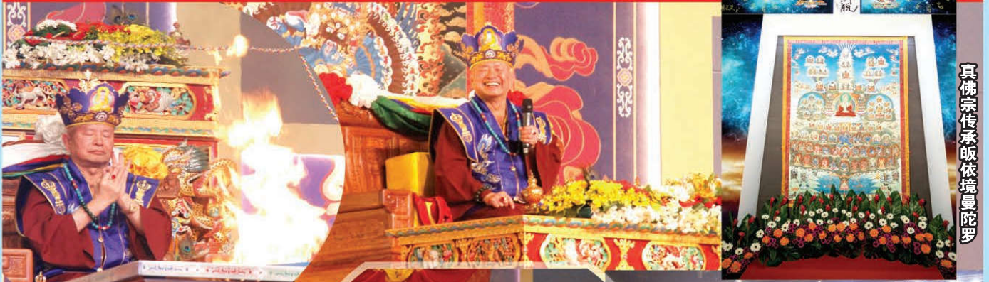
真佛宗传承皈依境曼陀罗