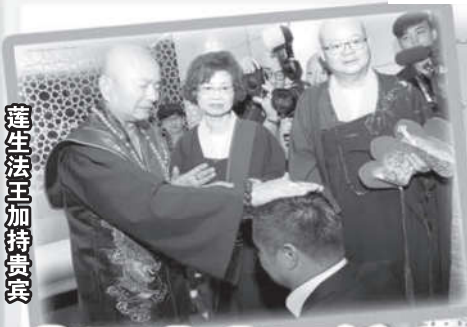
莲生法王加持贵宾