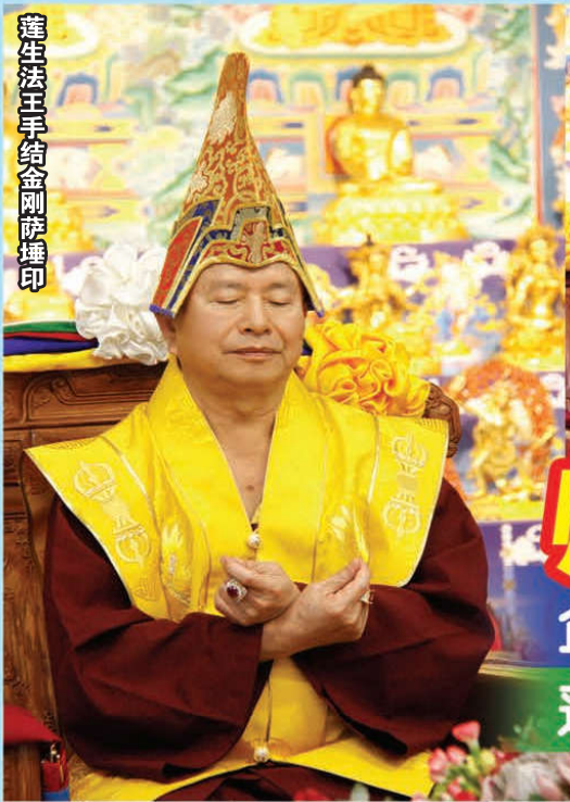
蓮生法王手結金剛薩埵印