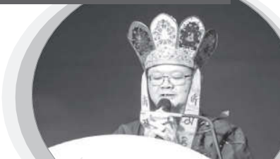
馬密總總會長釋蓮太金剛上師 2017年12月16日馬來西亞大幻化網金剛大法會致詞

师尊这50年来坚持每日写一篇文章，至今已出版了260余本文集，将其一生的修行心得一一收入在系列「莲生活佛文集」，导人向上向善，实属难能可贵！我们务必好好珍惜，每日阅读一篇文章，每日实修「真佛密法」，才不辜负师尊、