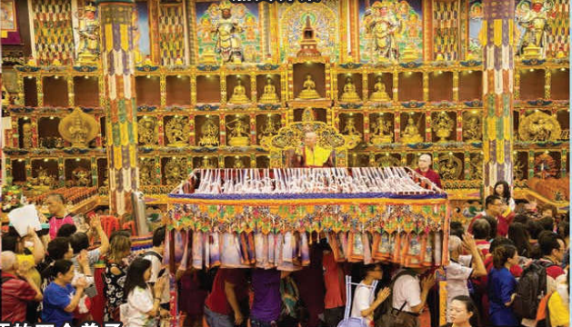
师尊加持受灌顶的四众弟子

【杏子/马来西亚吉隆坡报导】2017年12月17日，当代法王莲生活佛卢胜彦在马来西亚弘法行程的第四天。当日上午11点左右，法王驾临霹靂州怡保雷藏寺，主持落成开光大典仪式，万名四众弟子前来护持，同沐佛恩，恭聆法语佛音。