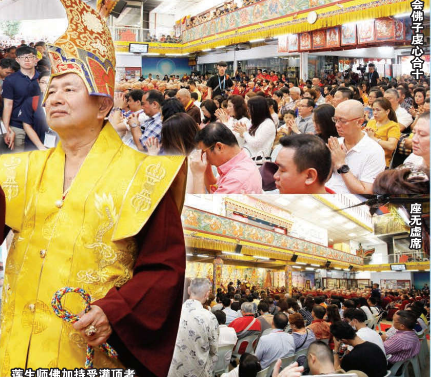
與會佛子虔心合十