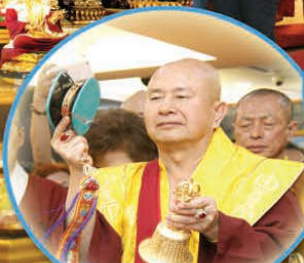
师尊以金刚铃鼓加持坛城