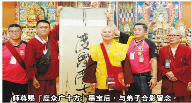
师尊赐「度众广十方」墨宝后，与弟子合影留念。