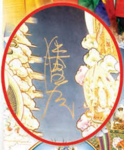
师尊在曼陀罗上签名