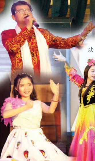
法輪雷藏寺手語演出