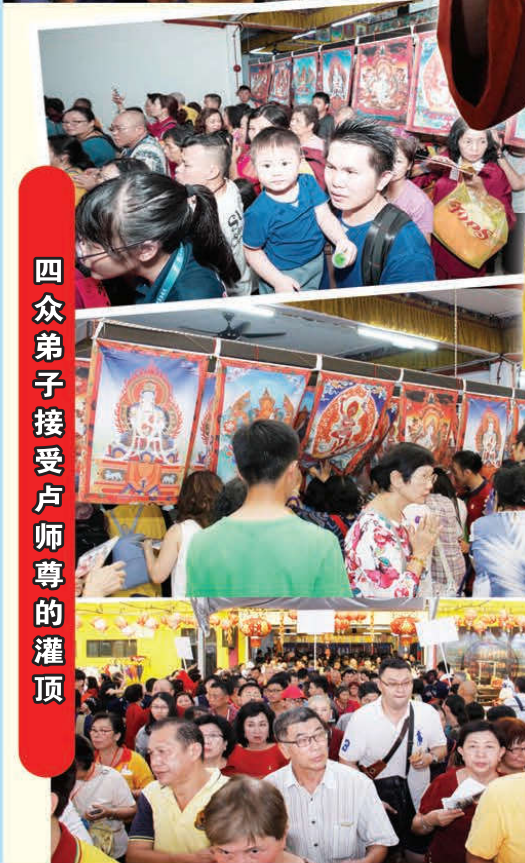
四眾弟子接受盧師尊的灌頂