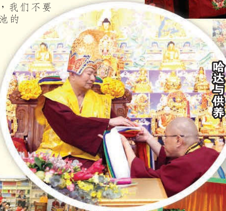
蓮生師代表敬獻哈达与供养