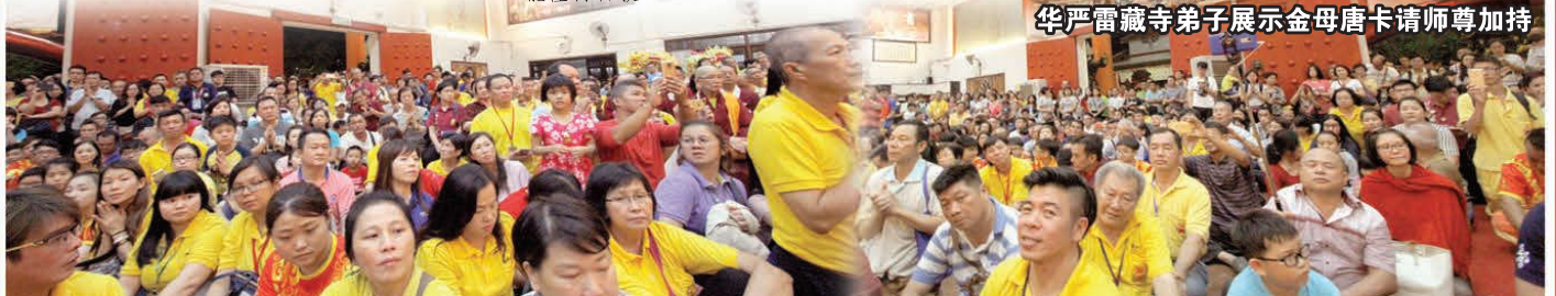
善信護持座無虛席