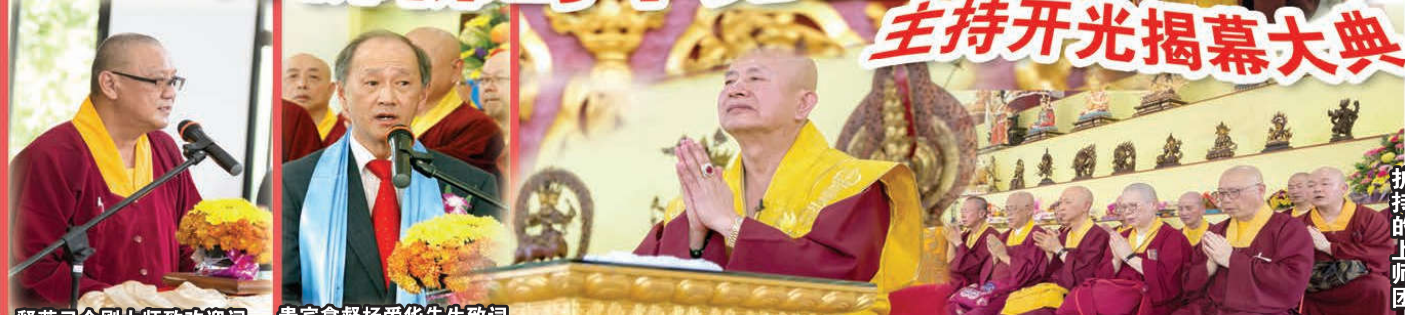
釋蓮已金剛上師致歡迎詞