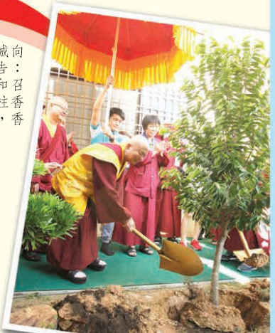
师尊在平和养老院植树