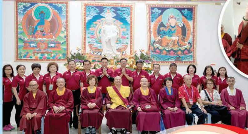
师尊、师母在平和养老院坛城前与弟子合影