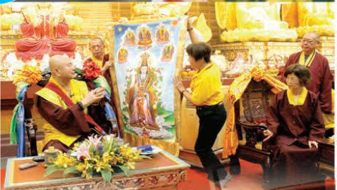
華嚴雷藏寺弟子展示金母唐卡請師尊加持

人，因此，行者必須要有智慧分辨什麼是正、什麼是邪。」「只要有正念，學佛是拜佛菩薩，不是拜鬼。有做結果，就可避開鬼（XX）的干擾。」師尊也提醒大眾，雖然有的上師很優秀，但並不是每個上師（例如XX）都是好上師，也就是要觀察這個上師是否有正念。大家要注意這個上師：是不是專門斂財、撈錢？有沒有真正的真佛傳承？是不是在搞鬼、拜鬼？是否貪心、嗔怒、愚痴？是否騙人、吹牛、喜歡講假神通？ 師尊告誡弟子，要不是他識破XX的鬼計，一再教導眾等如何分辨正與邪，「以破邪顯正，我們真佛宗就差點變成真鬼宗了。」最後，師尊再次說明「米衣收煞法」的要訣，期望弟子們也能懂得自救。