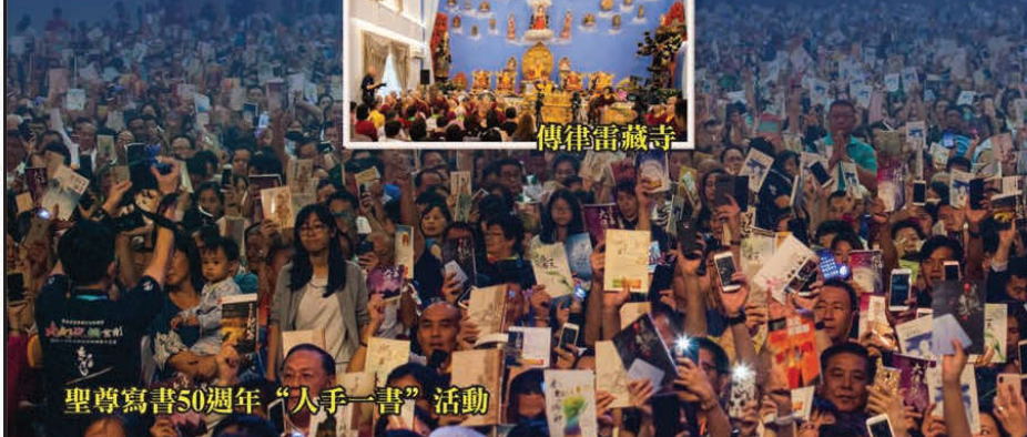
聖尊寫書50週年“入手一書”活動

五百万弟子之师，真佛宗创办人莲生活佛王卢胜彦师尊於12月16日正假马来西亚国际贸易展览中心(MITEC)主持“大幻化网金剛法流護國除疾賜福超度護摩大法會”展开一连串的弘法行程，在大马短短8天之内，除了主坛大法会，并法驾9座雷藏寺开光加持、为本来教育大楼开幕、莅临2道场加持及为直心雷藏寺主坛动土仪式，其中更不断为有灵障的信徒们摩顶和加持。真佛宗马来西亚密教总会於16日之大法会成立【莲生教育基金】资助清寒而成绩优异的学子深造，培育英才和协助教育计划。法王也在大法会为国家及社会大众祈福祝祷，祈求马来西亚国泰民安、风调雨顺，人民富足喜乐。