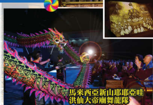
馬來西亞新山耶耶亞哇洪仙大帝廟舞龍隊