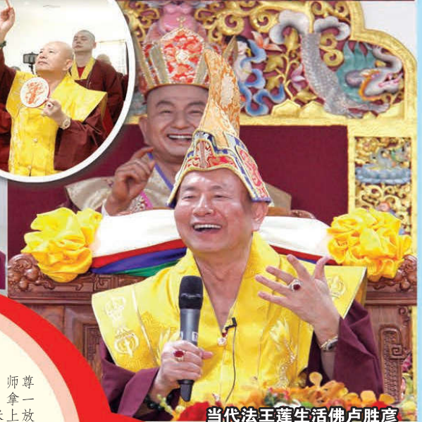
当代法王莲生活佛卢胜彦

【日升/马来西亚吉隆坡报导】2017年12月18日上午8点，莲生法王卢胜彦佛驾大马直心雷藏寺主持动土仪式。随后即前往平和养老院和本然大楼，主持开幕剪彩典礼、植树以及赐授灌顶。