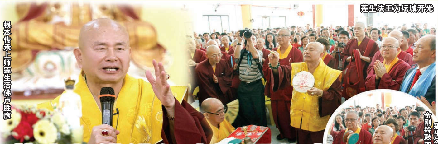
蓮生法王为坛城开光