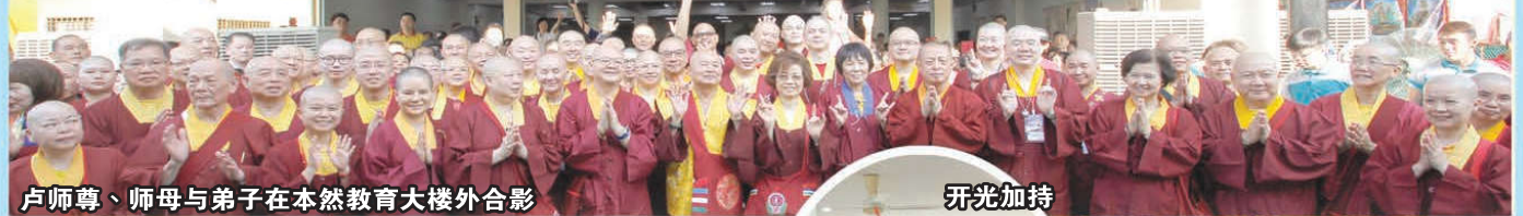
卢师尊、师母与弟子在本然教育大楼外合影