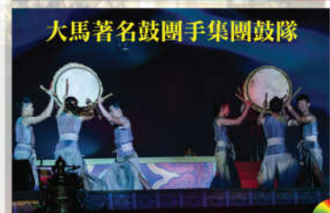
大馬著名鼓團手集團鼓隊