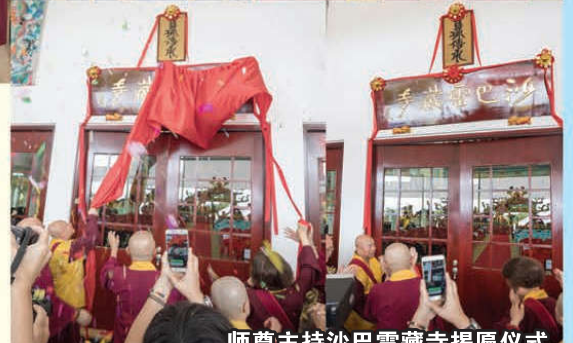
师尊主持沙巴雷藏寺揭匾仪式

咒，已成为华光佛；莲上师一心依止根本传承也成为华光佛；莲上师往生佛国净土；丁上师和台湾尤上师亦成为寺庙正殿主尊；不仅如此，尚有其他上师为地方山神，有的到天界，但也有在三恶道的。师尊表示，已在此次大法会中将他们接引出来到更好的境界。