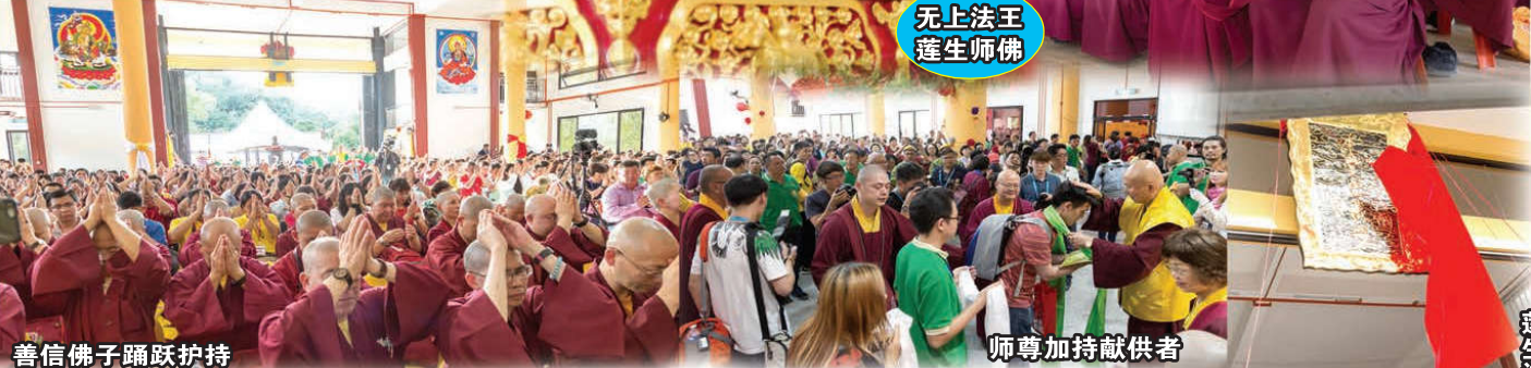
无上法王 蓮生师佛