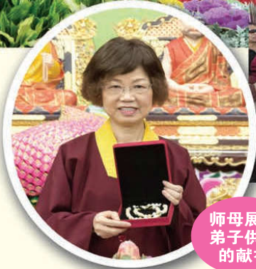
师母展示弟子供养的献礼