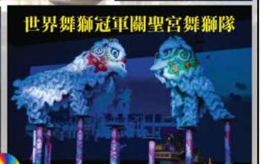
世界舞獅冠軍關聖宮舞獅隊