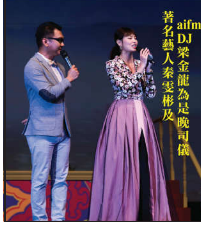
著名藝人秦雯彬及 aifm DJ 梁金龍為是晚司儀