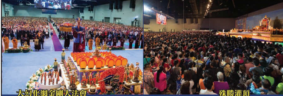
大幻化網金剛大法會