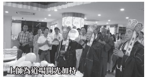
上師為道場開光加持

NO.B-3-17 & B-3-18, JALAN 2/142A, MEGAN PHOENIX, KM10, OFF JALAN CHERAS, 56000 KUALA LUMPUR.