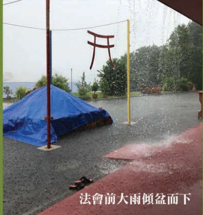
法會前大雨傾盆而下