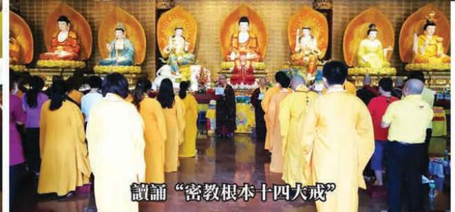
讀誦“密教根本十四大戒”