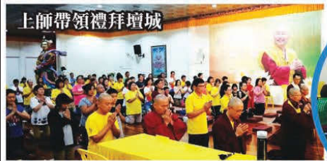
上師帶領禮拜壇城