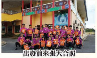
出發前來張大合照