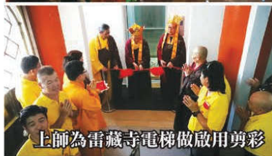
上師為雷藏寺電梯做啟用剪彩