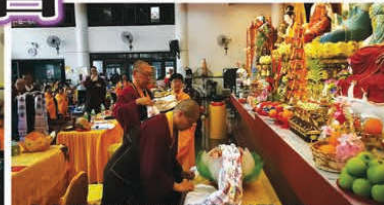
上師們帶領與會大眾敬獻哈達手根本傳承上師