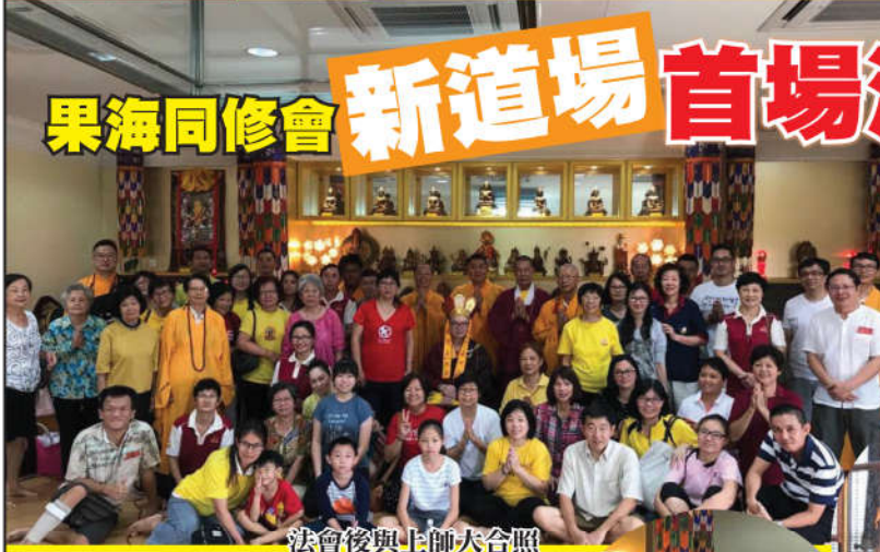
法會後與上師大合照