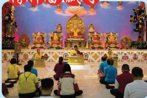
於2018年4月15日，開始誦經迴向美國6月30日師尊主壇的「羅天大醮」法會吉祥圓滿！