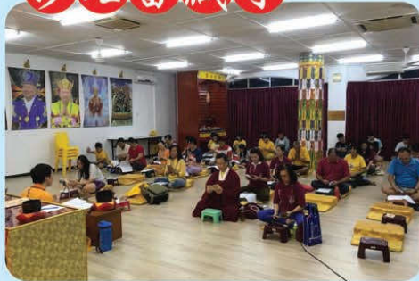
於2018年5月7日，誦念真佛經迴向美國6月30日師尊主壇的「羅天大醮」法會吉祥圓滿！