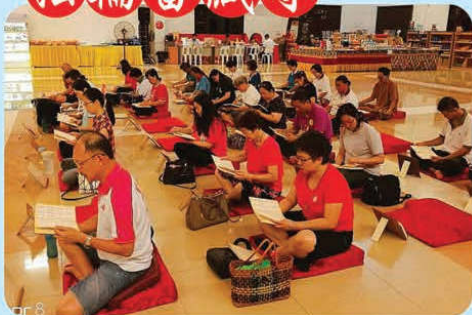
於2018年5月8日，開始誦經迴向美國6月30日師尊主壇的「羅天大醮」法會吉祥圓滿！