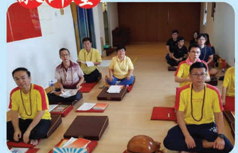
於2018年5月1日，誦念真佛經迴向美國6月30日師尊主壇的「羅天大醮」法會吉祥圓滿！