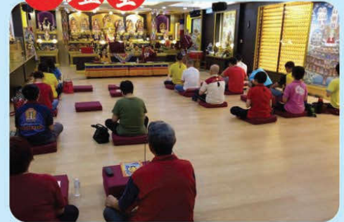
於2018年5月3日，開始誦念真佛經迴向美國6月30日師尊主壇的「羅天大醮」法會吉祥圓滿！