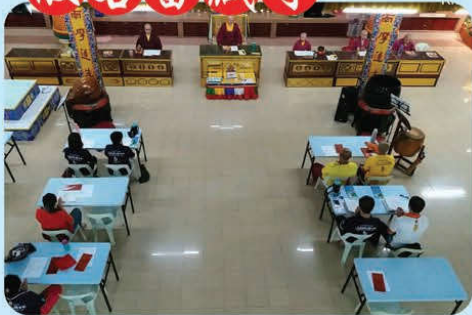
於2018年4月10日，開始誦經迴向美國6月30日師尊主壇的「羅天大醮」法會吉祥圓滿！