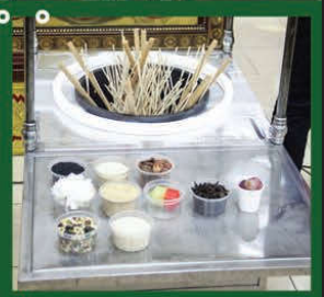
▲ 護摩火供基本供品黑 / 白芝麻、檳榔、花、香、燈、茶、果、五色豆、白米