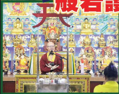
▲ 上師示範金剛鈴、杵的基本拿法