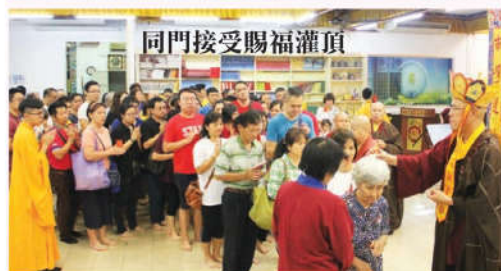
同門接受賜福灌頂

來越大，所以產生了很多的人我是非。大家在道場互相摩擦才是『破我執』最好的地方。當我們在這個地方越磨越久，就要跳出來看一看，打破自己的我執，雖然說易行難。但是道場的确是破我執最好的地方。