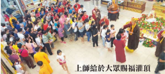
上師給於大眾賜福灌頂

根據師尊的解說，大白蓮花童子是第十三地的佛，祂的根源是大日如來，跟大日如來一起的就是佛眼佛母，佛眼佛母的雙眼化為摩訶雙蓮池，西方極樂世界是以阿彌陀佛為主尊，而摩訶雙蓮池是以大白蓮花童子為主尊。《高王經》里的第一句佛號『南摩淨光秘密佛』，師尊講過，其實這一尊就是蓮花童子，所以這一尊的來歷非常的殊勝。此外，在藏傳佛教的法門