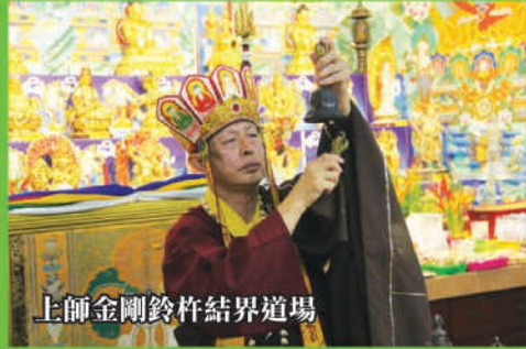
上師金剛鈴杵結界道場

(文接第8版 般若雷藏寺~南摩蓮華生大士最胜宝息、增、怀、誅法超度藏密式护摩法会)