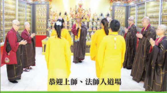
恭迎上師、法師入道場