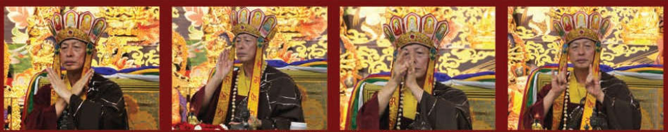
上師教授最勝寶息、增、懷、誅、手印

蓮華生大士最勝寶息增懷誅法——降伏的手印如下圖。蓮華生大士最勝寶降伏壇，以黑色三角形立壇。供品主要以藍綠黑色為主，蓮華生大士降伏法的心咒是『吽。媽拉耶。呸。』。觀想蓮華生大士跌坐於蓮華月輪之上，蓮師心輪現綠色的『唵』