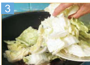
3 將包心白菜放入鍋中，拌炒均勻後，燜至熟透即可起鍋。