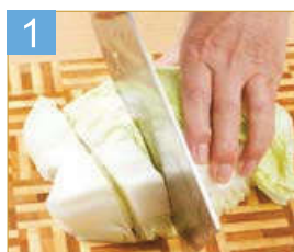
1 將包心白菜洗淨，依橫向切片備用。

食材 (2人份) 包心白菜 半顆 乾洛神花 3朵 甘草 1~2片 枸杞 10錢 薑片 少許 鹽 少許