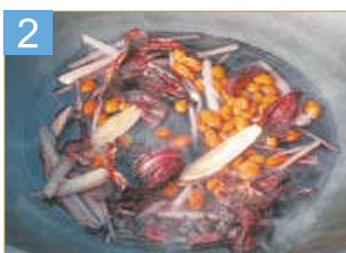
2 將乾洛神花、甘草、枸杞、薑片及鹽放入鍋中，倒入2杯過濾水煮沸。