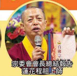
宗委會會長總結報告 蓮花程祖上師