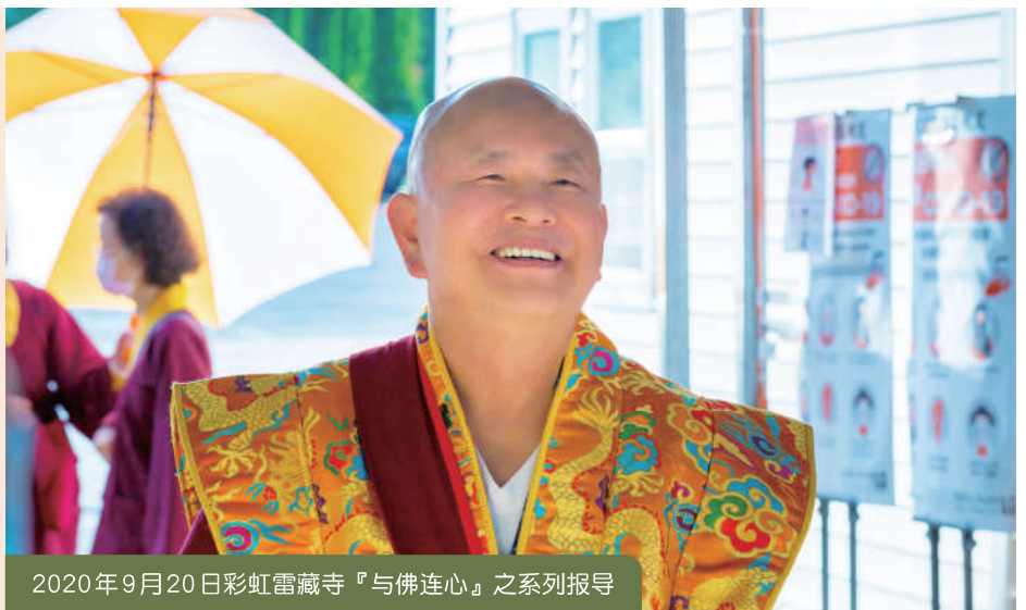
2020年9月20日彩虹雷藏寺『与佛连心』之系列报导

护摩结束后，大家一起跪拜顶礼感谢师尊主坛护摩法会的辛劳，师尊也带领大众过火。回到大