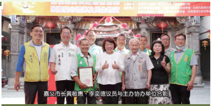
嘉义市长黄敏惠、李奕德议员与主办协办单位合影

市长致词时表示，来到城隍庙是令人欢喜安心的地方，虽然行程满满，也一定要来此跟大家结缘，本活动让弱势者在中秋月圆时刻，满满爱心，