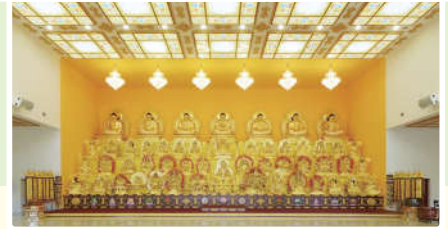
加拿大净印雷藏寺

加拿大净印雷藏寺位于众多华人居住的多伦多，是一座建筑庄严宏伟，坛城细致精巧兼具密教特色，其寺内佛像金碧辉煌堪称第一，摄召大众气势磅礴的大道场。