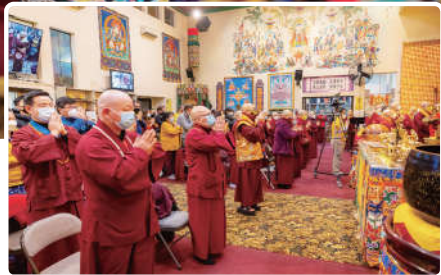
信心清淨 來自實踐四相 窮貫三際 橫遍十方

十二月十一日晚間, 法王至尊蓮生活佛於美國西雅圖雷藏寺同修「黃財神本尊法」。法王開示, 佛教有七正財, 不一定指錢財。在大地最富者為堅牢地神, 海中富者龍王, 天上富者四天王, 其宮殿皆七寶所成, 有很多數不清的珍寶。佛陀時代上座部戒律嚴, 不可碰錢; 大眾部戒律較寬鬆, 度眾生比較多。而現代教團則納法財, 建造莊嚴廟宇攝召眾生。法王祈求黃財神賜財福予真佛宗弟子。