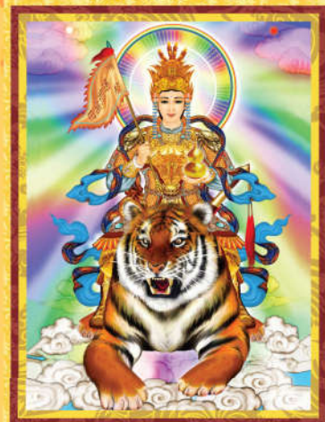
【真佛宗根本傳承上師 聖尊蓮生活佛傳授-未經灌頂請勿修習】