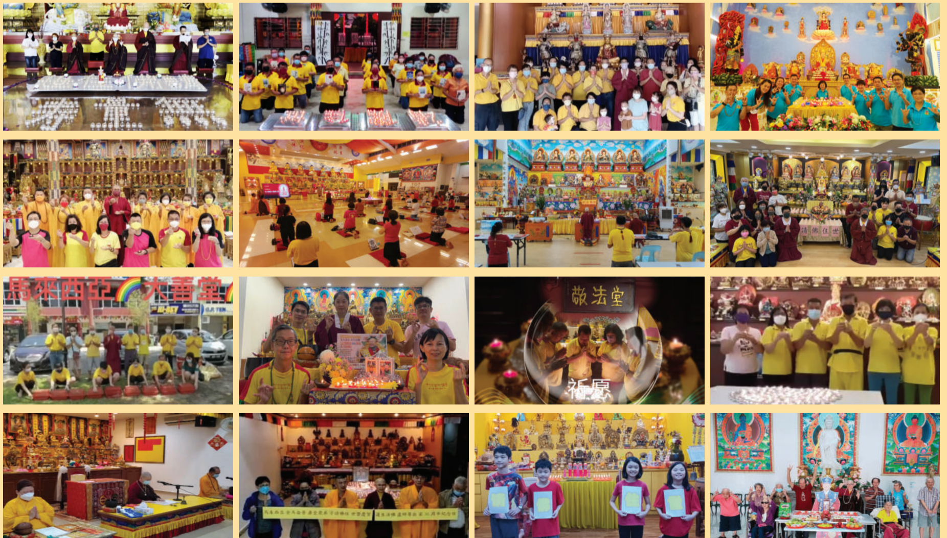
參與活動道場有：般若雷藏寺、華嚴雷藏寺、秉公雷藏寺、蓮湖雷藏寺、傳律雷藏寺、怡保雷藏寺、法輪雷藏寺、沙巴雷藏寺、心燈堂、大善堂、常居堂、敬師堂、敬法堂、法顯堂、護清堂、敬天堂、中道堂、直心堂、妙智堂、方廣堂、普廣堂、戒明同修會、正覺同修會、平和養老院、