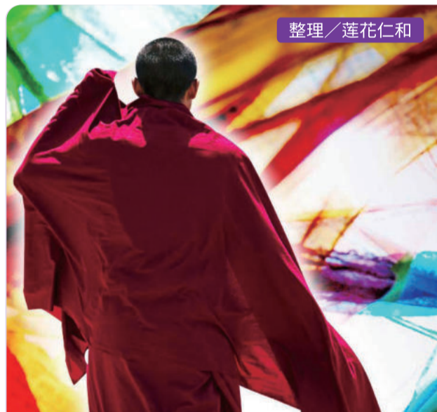
整理 / 莲花仁和

联络方式 14310 476th AVE SE North Bend, WA 98045-7931 U.S.A. TEL 425-888-3677 FAX 425-888-9008 info@tbs-rainbow.org