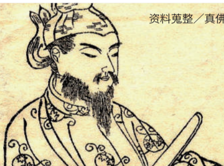
资料蒐整／真佛报总社