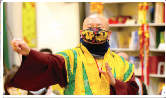
清淨法身本无相 非色身音声可求得