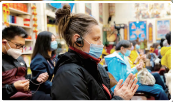
非断非灭 空中妙有