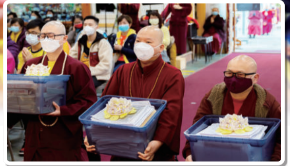
佛菩萨天王 转法轮者 皆俱三十二相

《金刚经》要义旨在于空性，其四句偈「无我相、无人相，无众生相，无寿者相」，是断一切有相的。然佛陀又说：「发阿耨多罗三藐三菩提心者，于法不说断灭相。」为什么已经发了菩提心的，在诸法上却不能讲一切都是空的、都是断灭的？