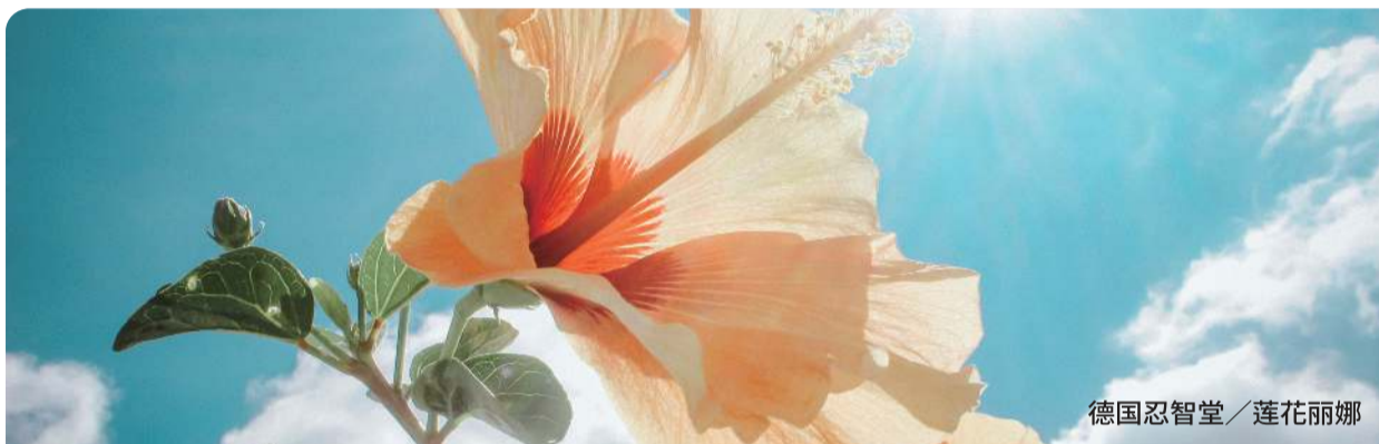
德国忍智堂 / 莲花丽娜

「霹靂州华光功德会」秉持创办人无上法王莲生活佛的咐嘱，在霹靂州各地进行社会关怀的服务，以平等心给予各族群的关怀与协助，每项个案都依当时情况与需求给予援助。感谢大家的发心支持，你们的善心和爱心，将温暖社会上每个角落的弱势群体。