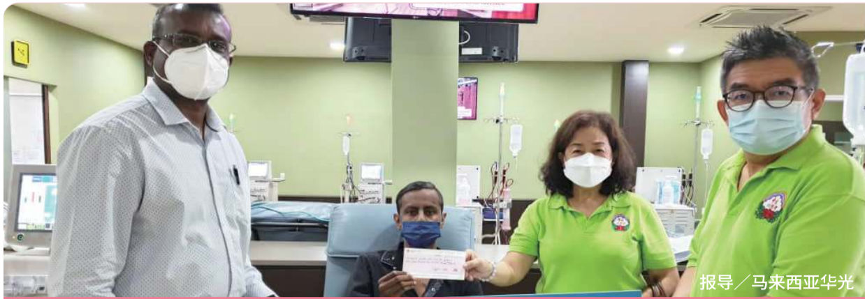
报导 / 马来西亚华光