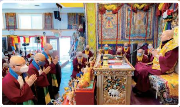
无上法王蓮生活佛講經圓滿 全球真佛弟子至誠感謝佛恩

无上法王聖尊蓮生活佛圓滿講授《金剛經》，于2022年5月1日圓滿。由世界真佛宗宗委會、西雅圖雷藏寺、彩虹雷藏寺代表全球四眾弟子感恩頂禮法王，敬獻哈达及供養以表最崇高之敬意。懇請聖尊長壽自在住世間，法輪常轉不捨離，利樂一切諸眾生！