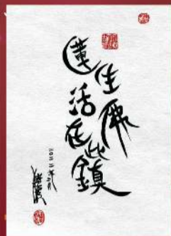
賜福全球參與會供壇場 贈送師尊「蓮生法鎖」墨寶