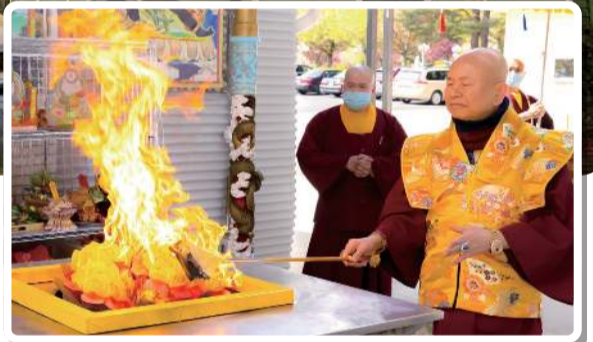
當代法王 蓮生活佛 實修實證 說法第一

五月一日，无上法王聖尊蓮生活佛于美國彩虹雷藏寺主壇「文殊師利菩薩護摩大法會」。法王開示，文殊師利菩薩于過去成佛為龍種上尊王佛，乃七佛之師化身無量。祂化身為菩薩成為釋迦牟尼佛的侍者，是華嚴三尊的法王子，也是八大菩薩上首。黃教的教主宗喀巴大師是文殊菩薩的化身，香巴拉佛國第一任的代種王也是文殊菩薩。在大乘裡面，文殊師利菩薩智慧第一。