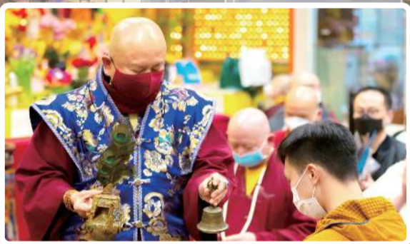
蓮生法王講經圓滿現祥瑞 巨大彩虹高懸祖廟上空

四月三十日晚間，无上法王聖尊蓮生活佛于美國西雅圖雷藏寺主持「藥師佛本尊法」同修，法王祈願藥師佛化解大瘟疫，病毒轉善利眾生，平息人間災難。