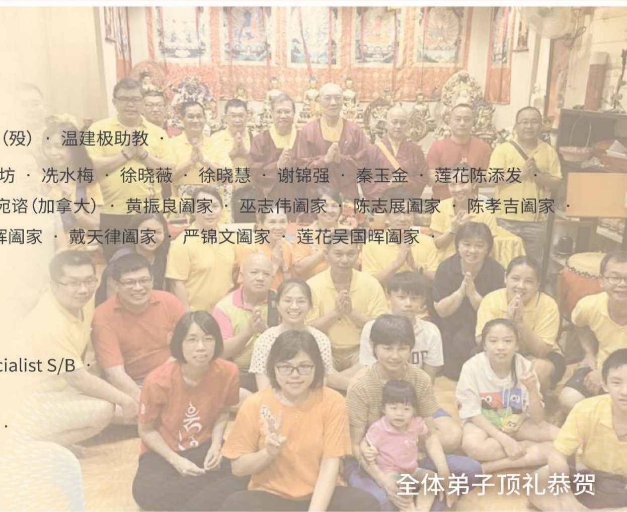
全体弟子顶礼恭贺