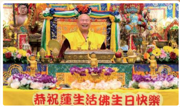
佛一舉一動與所說之法句 无一不是加持