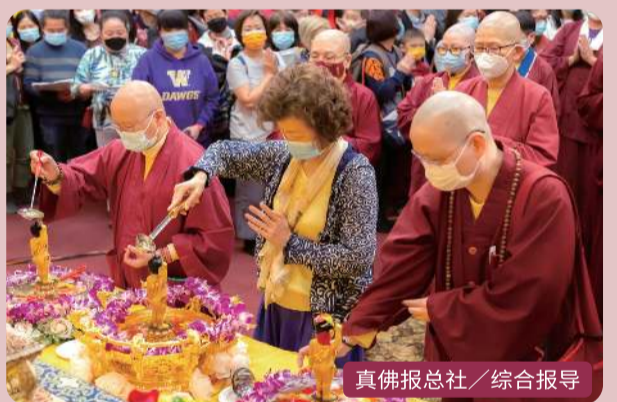
真佛报总社 / 综合报导