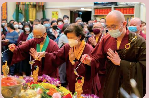
恭祝蓮生活佛生日快樂 釋迦牟尼佛浴佛節慶典