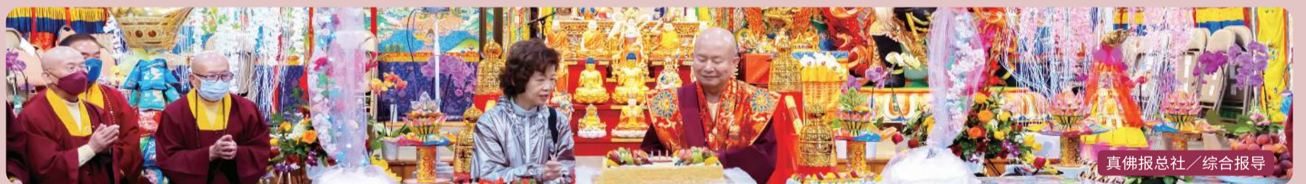
真佛报总社 / 综合报导