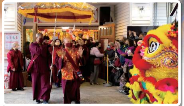
聖尊蓮生佛 當代大法王 集顯密禪宗傳承于一身

六月十一至十二日真佛宗宗委會發起「長壽三尊恭請佛住世大法會」，慶賀根本上師蓮生法王佛誕，共同携手真佛宗上師團、法師團暨各级弘法人員及全球真佛道場，以「尊勝佛母」、「白度母」、「長壽佛」后建三場 ZOOM 線上恭請法會。以至誠之心，一心請佛住世，迴向聖尊蓮生活佛：佛體安康、長壽自在、常住世間、恆轉法輪、利樂無量眾生界。