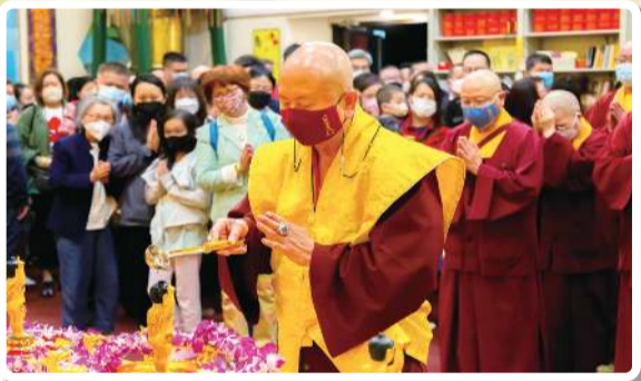
張燈結彩 舞獅獻瑞 祝願根本上師 福壽綿長體康泰