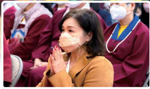
迷者眾生 悟者是佛

自六月初始，真佛宗宗委會便推動一系列恭祝蓮生活佛七秩晉八佛誕，請佛住世的活动，将整个六月都热闹起来。其中又以六月十一至十二日「长寿三尊荟供请佛住世大法会」，共同携手真佛宗上师团、法师团暨各级弘法人员及全球真佛道场，以「尊胜佛母」、「白度母」、「长寿佛」后建三场荟供法会为根本上师祝寿。