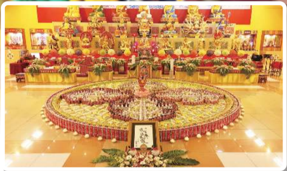
請佛住世大荟供 大圓滿大吉祥