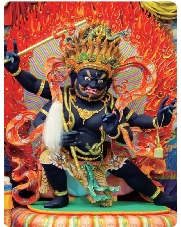
莲花童子忿怒尊 即是大力金刚尊

Patek Philippe 百达翡丽，你知道我开什么吗？他问，你知道我开什么吗？我开玩笑的。（师尊笑）