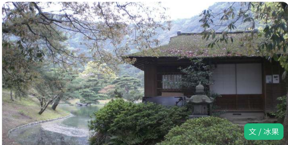
文 / 冰果