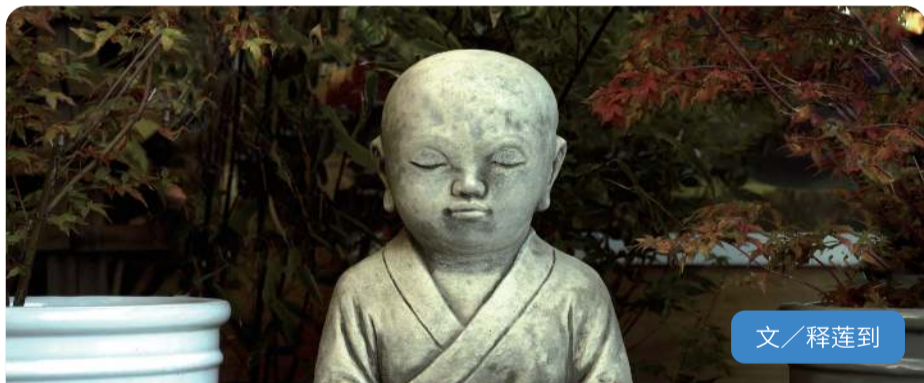
文 / 释莲到