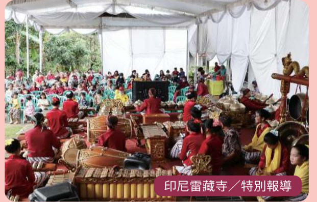
印尼雷藏寺 / 特別報導