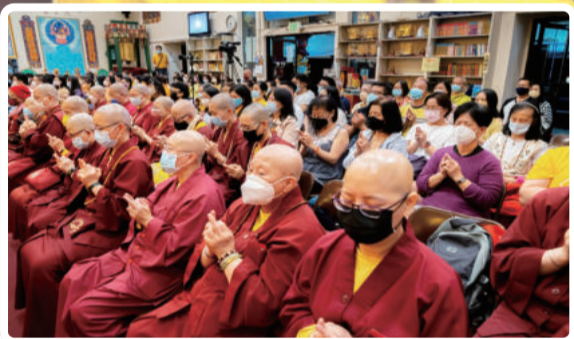
修行之中历练多 最终坚固心平静