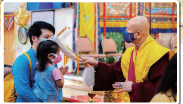
显教是堵法 密教是疏导法

禅定是加行中的一环，在修持的仪轨中属于正行。人人都想入禅定，但却不是人人都知道，究竟何为禅定。