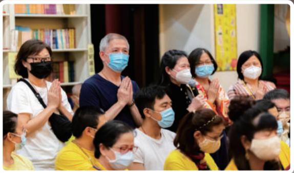
缘来随缘 自在快乐 不惊不怖 此即是定