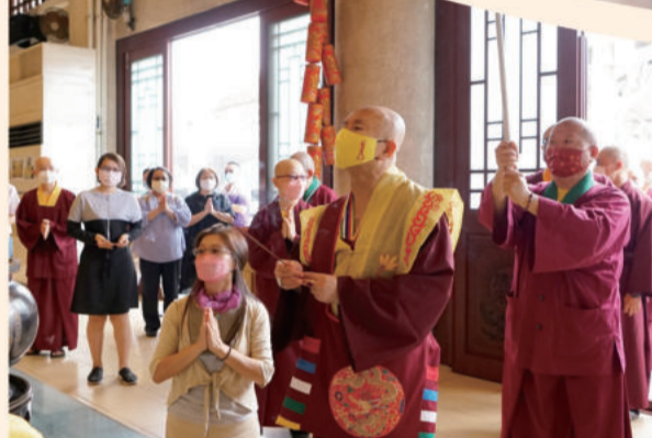
11月25日上午10点50分左右，法王步入台湾雷藏寺密坛上香。