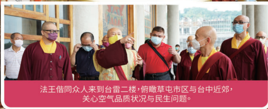
法王偕同众人来到台雷二楼，俯瞰草屯市区与台中近郊，关心空气品质状况与民生问题。