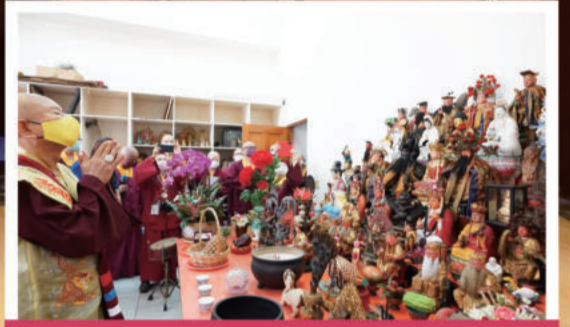
法王向早期台中故居内的坛城敬礼。此坛城现供奉于台湾雷藏寺。