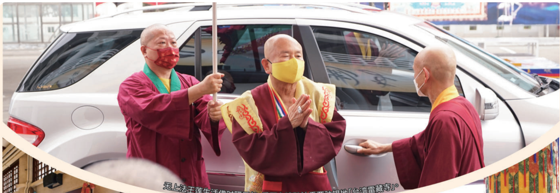
无上法王莲生活佛时隔三年，重回台湾弘法重要驻锡地「台湾雷藏寺」。