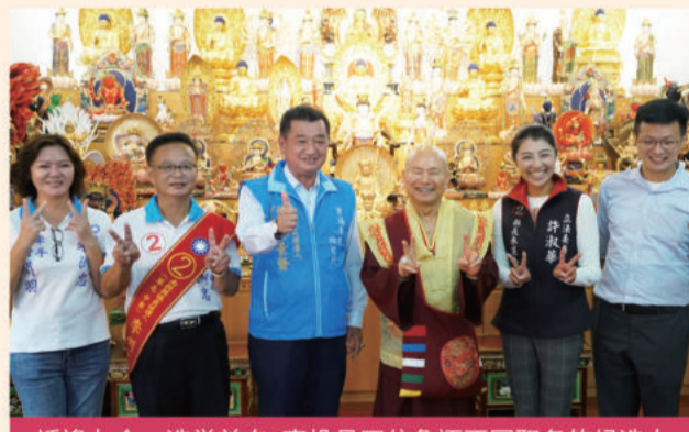
适逢九合一选举前夕，南投县四位角逐不同职务的候选人纷纷前来恭请莲生法王加持，祈愿能够顺利当选、连任。