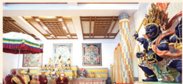
法王于真佛宗特有护法「大力金刚」塑像前驻足端详。