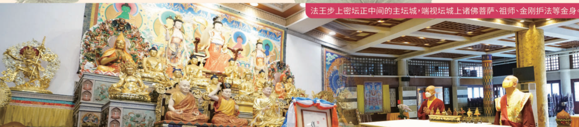
法王步上密坛正中间的主坛城，端视坛城上诸佛菩萨、祖师、金刚护法等金身。