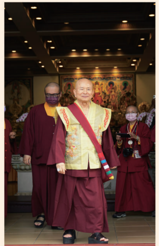
下午2时许，法王结束了当日共计四小时的巡视与加持，神情奕奕地启程返回住处。