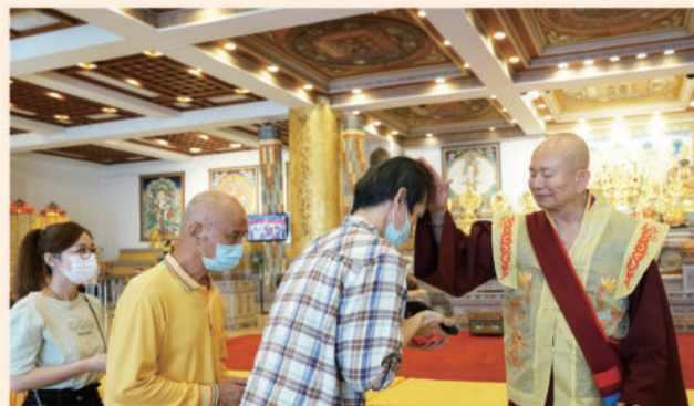
回到台雷一楼密坛中，法王为当日所有齐聚的弟子及善信们，一一摩顶，加持赐福。