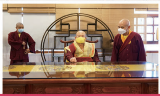
四楼真佛般若藏新设的书画展场，法王试坐座椅高低是否合宜。