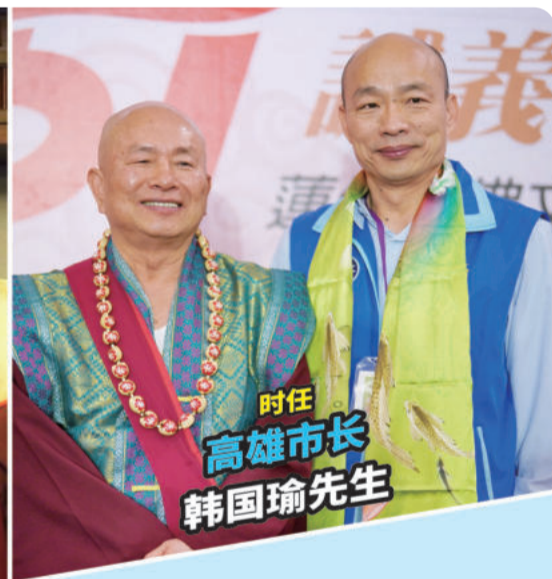
时任高雄市长 韩国瑜先生

2013年11月17日至尊返台弘法，郑文灿先生前来接机，当时至尊便告诉他：「你可以选上了。」尔后，郑文灿先生果真于2014年直辖市市长选举中，以将近50万票的差距，击败原本呼声极高的对手党候选人，当选桃园市市长，连任至今，功成圆满。