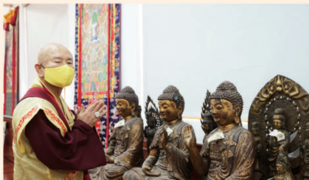
法王每每见到佛像金身，必定向其合掌敬礼，身教在举手投足中，不言而喻。