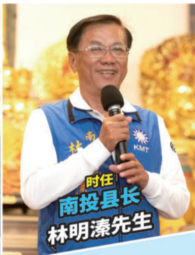
时任南投县长 林明溱先生