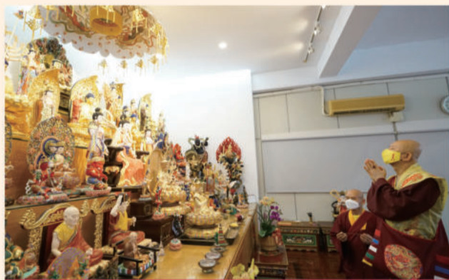
六楼问事房坛城十分庄严。

当日法王仔细确认台湾雷藏寺各处建设与寺内设施，并在过程中和齐聚一堂的弟子们话家常，关心众人的近况，也关心民生与空汙问题；莲生法王慈蔼温暖的心，于一言一行中表露无遗。直至下午2点，众人欢送法王乘车离去，4小时紧密的行程于焉告一段落。