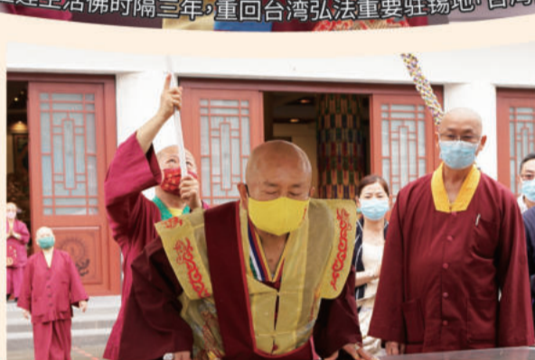
在台雷四大执事的伴随下，法王靠近查看新造的法会护摩炉。