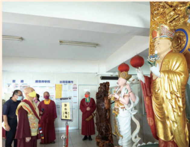
龙边四楼入口处，供奉有根本上师大型立像。