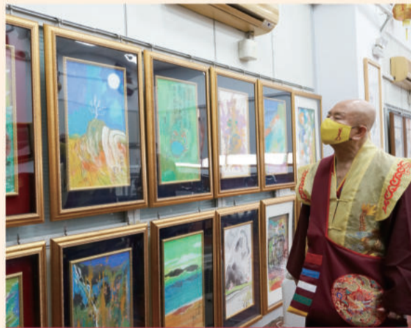
六楼问事房的牆面上，也展示出一幅幅法王的真迹墨宝。

2022年11月25日上午10点50分，真佛宗根本传承上师至尊莲生活佛再次重回台湾雷藏寺。由于全台仍在防疫之中，因此并未提前公开行程，不过，还是有许多邻近地区弟子闻风而来，可见所有弟子的心是多么雀跃，已经等不及要和根本上师见面了！不只本宗弟子，南投地区的候选人听闻消息，也特地前来参香祈福、恭请莲生法王加持。