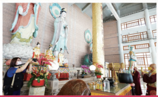
法王来到台雷大雄宝殿上香敬礼。