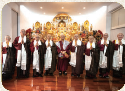
由根本上师 圣尊莲生法王授职的长老

2022年12月10日，世界真佛宗务委员会，恭请根本上师尊莲生法王进行了真佛宗长老上师授职仪式，及新晋教授师授职仪式。长老的敕封是由法王亲自点选，资深弘法人员的奉献，令真佛宗组织制度更趋完整，更深一层巩固度众的地基。由法师进阶为教授师则是通过考试甄选，确保有才之士能更进一步发挥度众的才能。