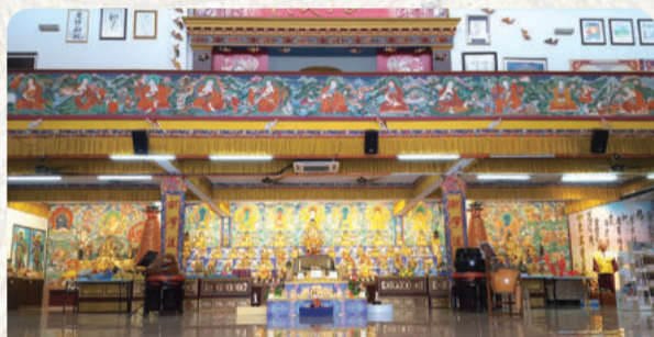
以蓮花童子為主尊殊勝莊嚴的大雄寶殿