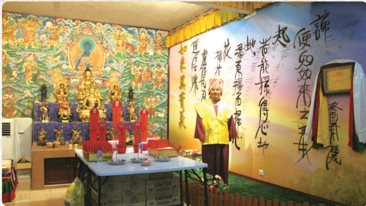
供奉不同主尊的「藥師殿」