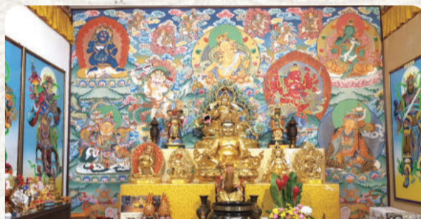
供奉不同主尊的「財神殿」