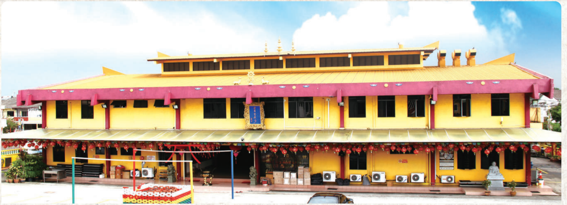
外观庄严恢弘的「般若雷藏寺」