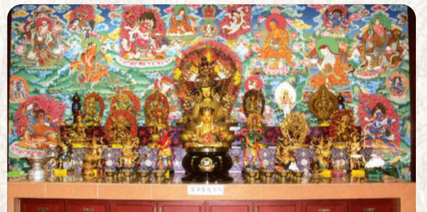
供奉不同主尊的「蓮師殿」