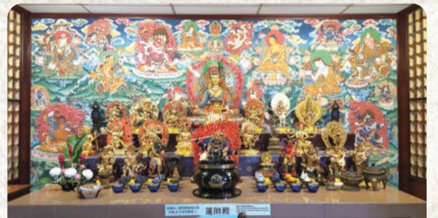
供奉不同主尊的「護法殿」