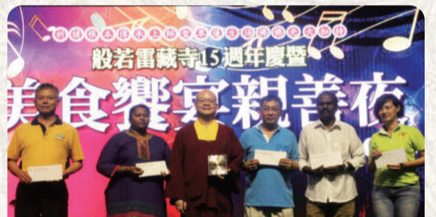
每年固定舉辦「親善之夜」活動，與在地民眾廣結善緣