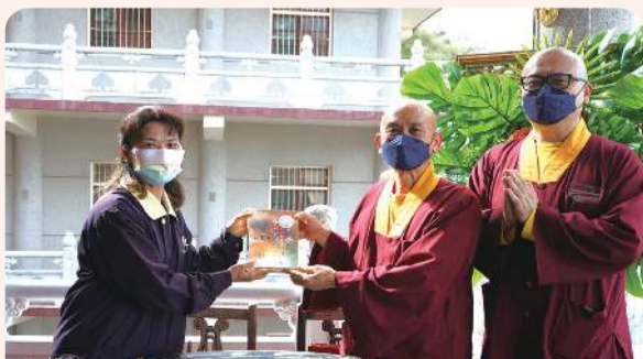
長老蓮哲上師代表致贈 蓮生活佛文集

此行除了悼唁星云大师，代表团也表达欢迎清德寺的住持慧龙法师，至台湾雷藏寺参访交流。并转达寺方，圣尊莲生活佛和慧龙法师乃熟识，下次返台想前来拜会住持。告别前，长老莲哲上师代表致赠圣尊莲生活佛文集及红包供养寺方，此行约一个小时的致意及参访，行程圆满吉祥。