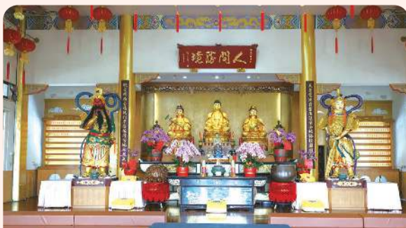
清德寺大雄寶殿供奉西方三聖