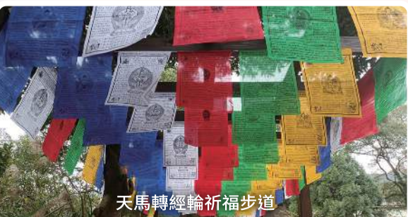
天馬轉經輪祈福步道