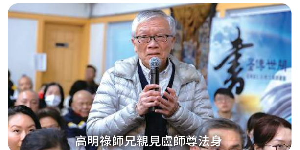
高明祿師兄親見盧師尊法身