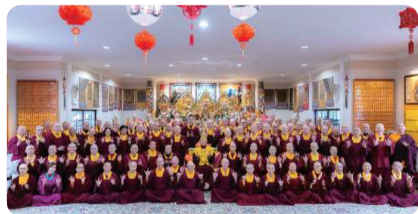
第六屆第三次春季 上師暨常務委員大會 假「彩虹雷藏寺」護摩寶殿 隆重拉开序幕

另外還有「靜態瑜伽」，譬如鼻子的瑜伽就是呼吸法，腦部的瑜伽就是觀想。尤其是呼吸法，從最粗的呼吸，進到細的呼吸，再到最細的呼吸，再到似有似無的呼吸，就是「龜息法」與「胎息法」。盧師尊特別強調：「當你學到呼吸法非常靜止的時候，你就能夠入三昧地。入三昧地有什麼用？真正入最深的三昧地，可以發現到『真我』，所謂的真我就是『佛性』」。更多精彩內容敬請詳閱本期真佛報。