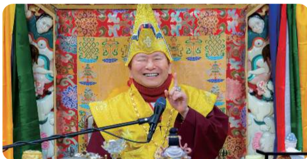
法王長年習練瑜伽 身體體健活力足 配合呼吸法可入三昧地 能發露佛性

蓮生法王開示，修習「七眼佛母天眼通秘密法」有三大要點，首先要經常向白度母祈禱祈求加持，簡單說就是要修持「白度母相應法」，與白度母相應，自然能獲得加持。但師尊賣個關子，說「白度母相應法」的口訣，都已寫在第299冊文集當中，只要買書來看就能明白。其二、就是要燒化飲用「天眼符」，此符現場與會者都有發放。其三、就是要修氣，只要能將氣運至天心，加上白度母及天眼符的加持，必能獲得天眼通。歡迎詳閱本期精彩內容。