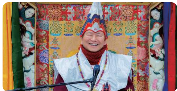
感恩聖尊首傳「七眼佛母天眼通秘密法」 白度母加持 修氣飲符 三者合一天眼開

佛弟子都知道，六大神通中有所謂「天眼通」，具足天眼通能夠擁有觀看其他法界的神通力。想要获得天眼神通并不容易，但蓮生法王却將此秘密法公開傳授，表示真佛法脈，將孕育出更多具足六大神通的尊貴行者。