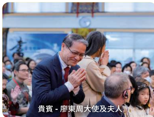
貴賓 - 廖東周大使及夫人