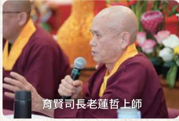
育賢司長老蓮哲上師