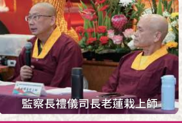
監察長禮儀司長老蓮栽上師