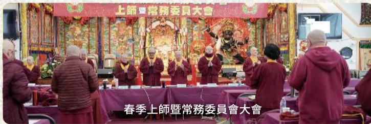
春季上師暨常務委員會大會