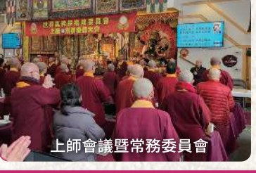
上師會議暨常務委員會