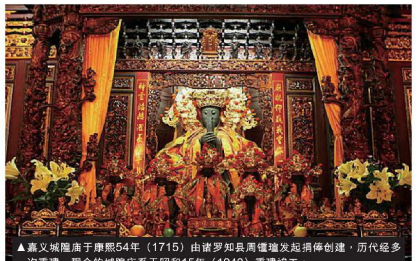
▲嘉义城隍庙于康熙54年(1715)由诸罗知县周鍾瑄发起捐俸创建,历代经多次重建,现今的城隍庙系于昭和15年(1940)重建竣工。