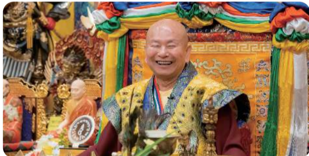
賀 師佛 300 文集《回歸星河》即將發行 看 盧師尊法身帶領弟子 游歷天上地下

有人不相信無常，我們一天當中，有時候歡喜、有時候生氣、有時候悲哀、有時候快樂，這就是無常。