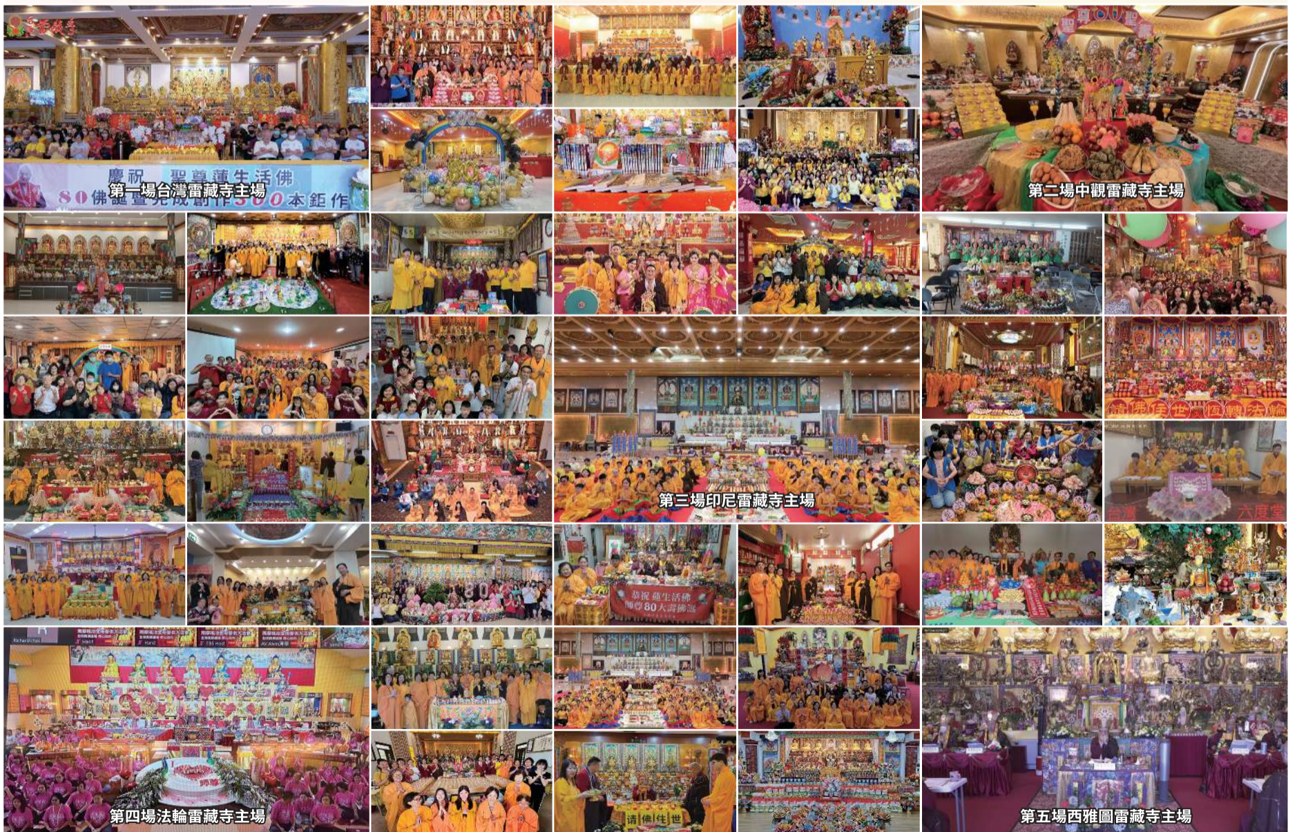
第一場台灣雷藏寺主場