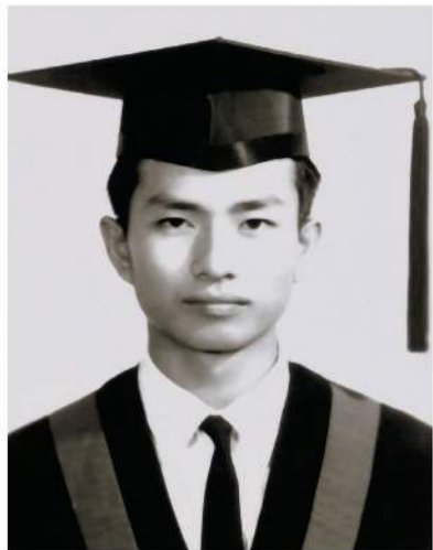
▲从测量学校大地测量系毕业的工学士照。