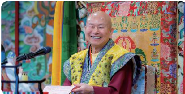
《維摩詰經》進入〈入不二法門品第九〉 盧師尊證得「同體心」視一切眾生都一樣