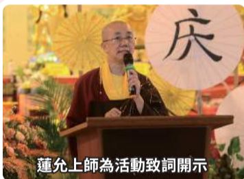
蓮允上師為活動致詞開示