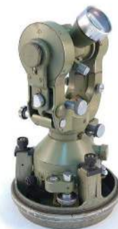
▲在瑞士WILD2壹秒读精密经纬仪是大地测量的重要仪器。