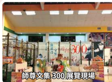
師尊文集300展覽現場