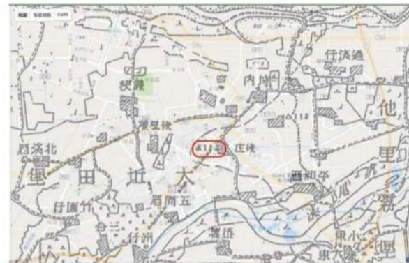
▲这是1905年的台湾堡图，一样能在图中看到三角点的标示。

胆爬上塔顶，一站上顶端，风很大而且没有栏杆！底下的人变的好小好小，高架水塔微微地摇晃，他感觉脚底一阵发麻往上窜到头顶，整个人似乎要从水塔上面飘下来，然而军人的天职就是使命必达，一定要完成任务的，在士官协助下，两人一个观测一个在旁边抄表、读数，完成了让他退役后都还记忆犹新的任务。