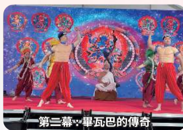
第二幕·畢瓦巴的傳奇