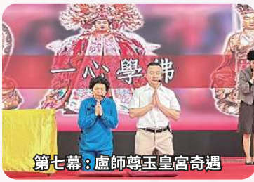
第七幕：盧師尊玉皇宮奇遇