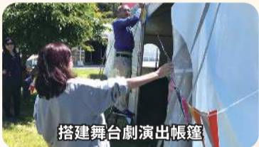
搭建舞台劇演出帳篷