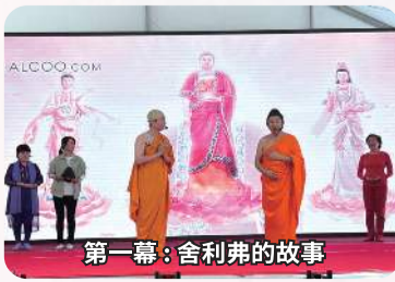
第一幕：舍利弗的故事