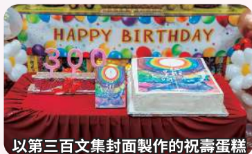
以第三百文集封面製作的祝壽蛋糕