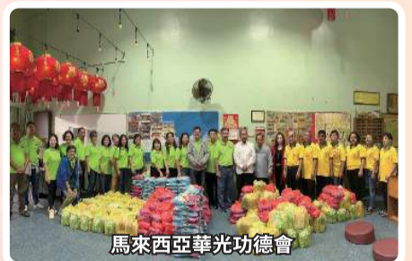
馬來西亞華光功德會