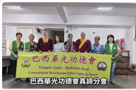
巴西華光功德會真諦分會 Temple Zenti - Budismo Real Comunidade Beneficente Lotus Light do Brasil