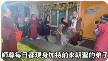
師尊每日都現身加持前來朝聖的弟子