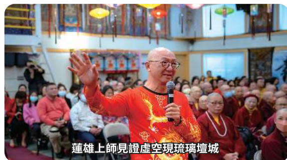
蓮雄上師見證虛空現琉璃壇城

我虽然信了佛陀释迦牟尼佛，其实佛陀的佛法，跟耶稣所说的法，是一致的。你看耶稣出来的时候，祂披的那个红袍，就是喇嘛装欸，祂到喜马拉雅山去学的，不是穿白的，就是穿我们现在穿的这个颜色的衣服，藏红色的衣服，不知道是跟着哪一个师父去学的？出来以后，祂就创了基督教；我只要一出来，我就创了真佛宗。瑶池金母是非常尊贵的。