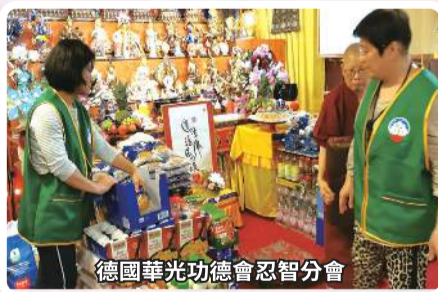
德國華光功德會忍智分會