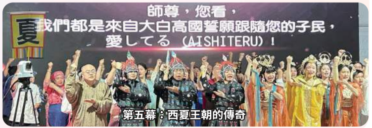
第五幕：西夏王朝的傳奇