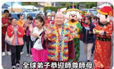
全球弟子恭迎師尊師母

活動最後播放馬密總制作「書代表我的心」的影音下，在 師尊 80 壽誕的前夕，以 師尊第 300 本文集《回歸星河》封面為圖案的特別蛋糕出場，師尊許願切蛋糕，特別有殊勝的紀念意義，相信與會大眾都會永遠銘記這溫馨而動人的一刻。