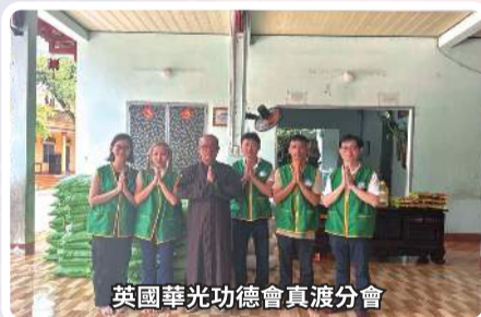
英國華光功德會真渡分會

台湾华光功德会，多年来对「华光小天使」的培育非常重视，公益慈善认养计划透过课程，关怀清寒学子。此外，台湾华光功德会每个月都有心灵关怀活动，定访冈山菜家，带给长者温暖。遍布全球各地的华光功德会，均秉持创办人蓮生活佛的精神，让爱无尽地传递，温暖众生的心。