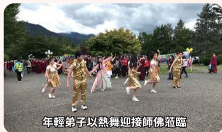
年輕弟子以熱舞迎接師佛蒞臨