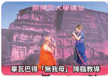
畢瓦巴得「無我母」降臨教導