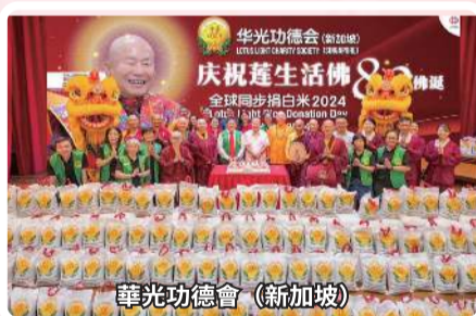
華光功德會 (新加坡)