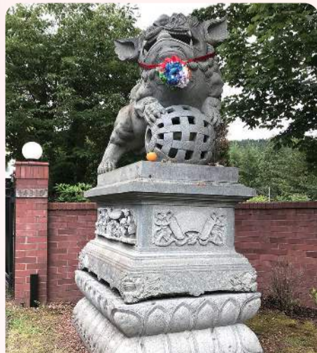
彩虹雷藏寺門口雄偉的獅王菩薩