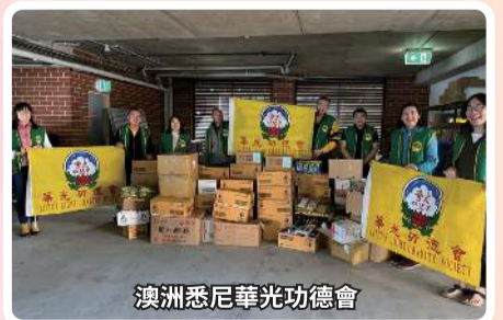
澳洲悉尼華光功德會