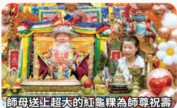
師母送上超大的紅龜粿為師尊祝壽