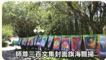
師尊三百文集封面旗海飄揚