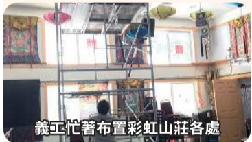
義工忙著布置彩虹山莊各處

張燈結彩喜洋洋，真佛宗的大喜事，全球弟子們全都沸騰起來，各個摩拳擦掌，想要對師佛表達最真誠的心，共同參與這此生難逢的大事紀。