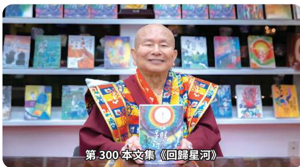
第 300 本文集《回歸星河》