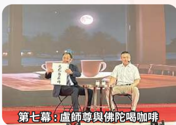
第七幕：盧師尊與佛陀喝咖啡