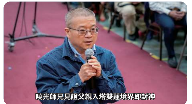
曉光師兄見證父親入塔雙蓮境界即封神