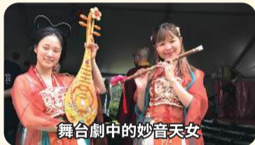
舞台劇中的妙音天女