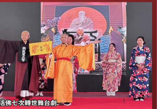
蓮生活佛七次轉世舞台劇