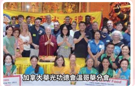
加拿大華光功德會溫哥華分會