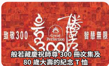
致敬 300 般若藏慶祝師尊 300 冊文集及 80 歲大壽的紀念 T 恤