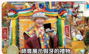
師尊展示假牙的禮物