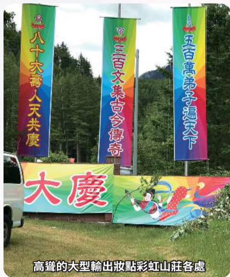
高聳的大型輸出妝點彩虹山莊各處