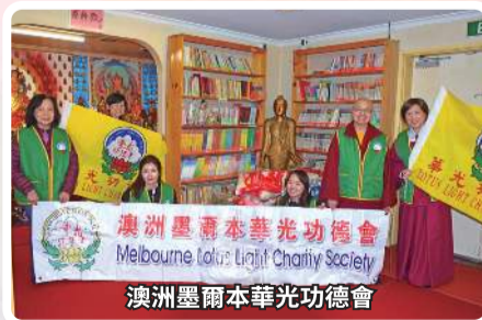
澳洲墨爾本華光功德會 Melbourne Loke Light Charity Society 澳洲墨爾本華光功德會