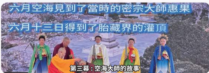
第三幕：空海大師的故事

历经舍利弗、毕瓦巴、空海大师、西夏王朝仁宗、宗喀巴等等的转世，当年佛陀为舍利弗授记为『华光佛』，两千年时光也只是一刹那，这一世释迦牟尼佛为本源是来自西方极乐世界，阿弥陀佛化身为大白莲花童子的莲生活佛，授记为『华光佛自在佛』，这一世开宗立派、广度众生、大转法轮、大击法鼓，至今已经度众 500 余万，写书逾 300 多本。今日，真佛众弟子恭逢其时，何其有幸，真正是百千万劫难遭遇，愿生生世世追随师佛，恭祝 师佛 佛体安康 长寿自在 大转法轮！