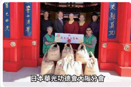
日本華光功德會大阪分會