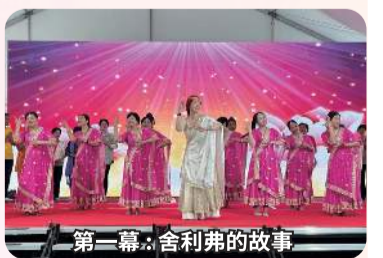
第一幕：舍利弗的故事