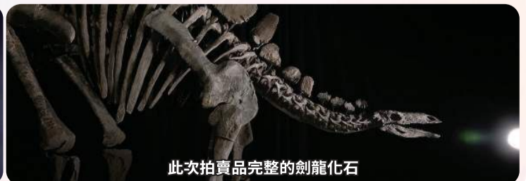
此次拍賣品完整的劍龍化石