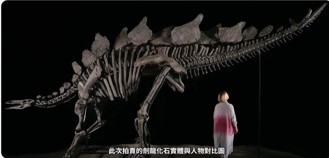
此次拍賣的劍龍化石實體與人物對比圖