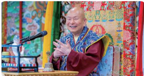
盡或無盡皆無煩惱 入不二法門 有我無我皆不可得 入不二法門

盧師尊本身與藏王松贊干布可說極為相似, 盧師尊開宗立派貴為法王, 同樣證得無上成就分身無量。近期更有無數的真佛弟子, 紛紛起身見證他們與盧師尊法身真實相遇的故事, 令聞者動容。究竟要如何才能親見師尊法身, 獲得根本上師法身的現身加持呢? 盧師尊認為重點在於「一心」, 當你心無雜念時, 根本上師就會显现。更多完整的精彩開示內容, 敬請詳閱本期真佛報。