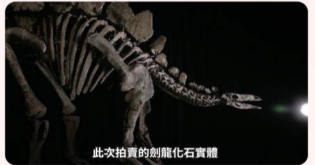
此次拍賣的劍龍化石實體