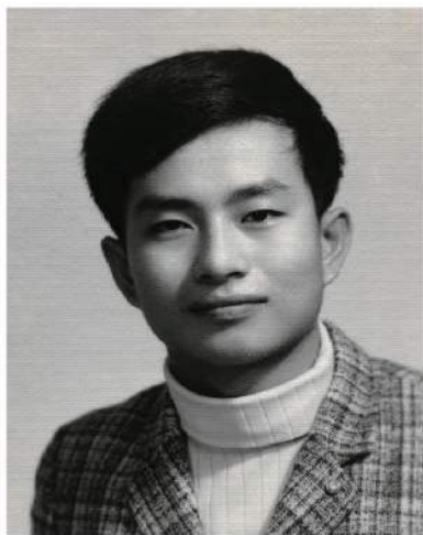
▲20几岁的卢胜彦，为救度众生将遍历道显密学法。