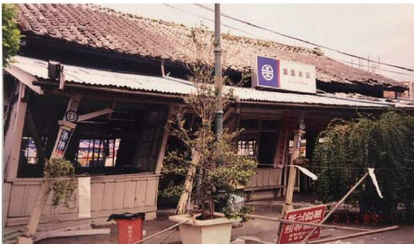
▲921大地震后歪斜的集集火车站。

很危险的，智者不屑，愚者敌对，还没有弘法，就已经报销了！就像很有钱的人一样，要很谨慎的处理钱，隐藏它，让人看不见，免得遭来了祸害啊！」「莲生，我教你佛法，你已得慧命，知晓大智慧，证智慧解脱，这样子的成就，未来只有三途。」