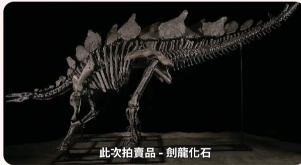
此次拍賣品 - 劍龍化石