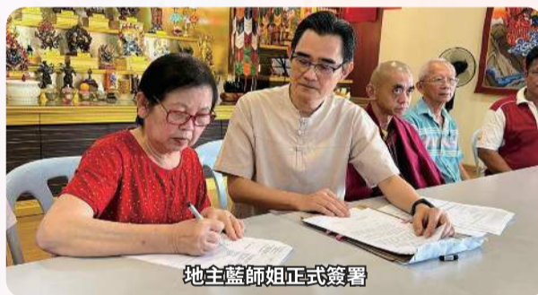
地主藍師姐正式簽署