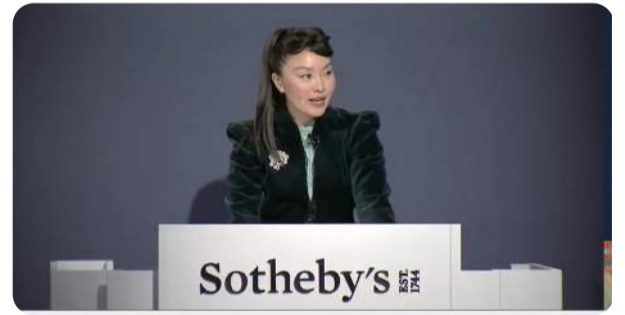
大敬愛主尊護摩 加持高律琪師姐 創蘇富比恐龍化石拍賣最高價

正如十六世大寶法王教導盧師尊的心要: 「要常常心中有光明, 只要你心中有光明, 就是你自己這一生的價值。」因此盧師尊強調, 修行最重要的, 就是修出自己心中的光明, 心中的清淨, 如此而已。