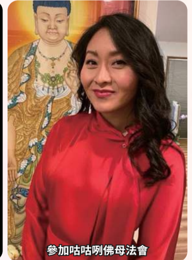
參加咕咕咧佛母法會