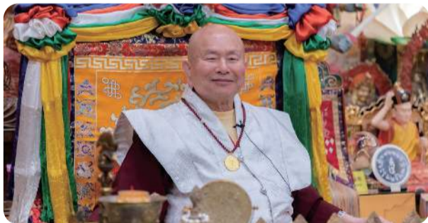
松贊干布書柱間史 觀音無盡化身度藏人 盧師尊法身無量 弟子一心祈求必定現身

蓮生法王開示: 修行, 最重要的, 就是修出自己心中的清淨與光明, 這個就是修行的價值; 如果心中沒有光明, 活在這世界上, 等於白活。修行不但要修出清淨光明心, 更要認識自己的佛性, 當你認出自己的佛性, 你就能夠有成就, 這叫做「自心明白金剛」