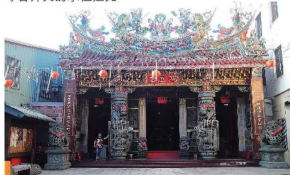
▲集集广盛宫(又称为妈祖庙)1999年(民国88年)倾毁于921大地震，妈祖金身左肩亦遭毁损。后来在各界捐赠与政府补助下，按照原先格局完成重建。