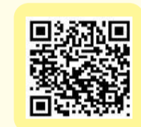
法王躲猫猫影片連結

这么伟大平易近人的法王应该前无古人，后无来者吧！当天的影片经过播出之后，短短几天，有三万七千个点赞，一百八十次的分享与转发，累积上千个赞，在此与大家分享。