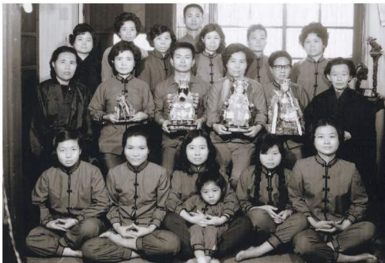
▲在力行路39号的[慈惠雷藏寺]，摄于民国61年，左一即是文中提及的5寸高地藏王菩萨。