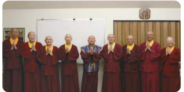
守護弘揚真佛宗法統與傳承 傳法部第二屆司長選舉圓滿完成

本周《維摩詰經》〈入不二法門品第九〉,已將進入尾聲。首先登場的是珠頂王菩薩,菩薩曰:「正道邪道為二。住正道者,則不分別是邪是正,離此二者,是為入不二法門。」