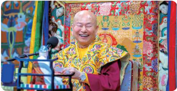
不分別正與邪 即入不二法門 不分彼此愛眾生 即不二法門