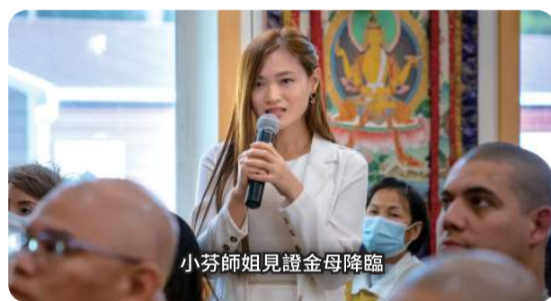
小芬师姐見證金母降臨