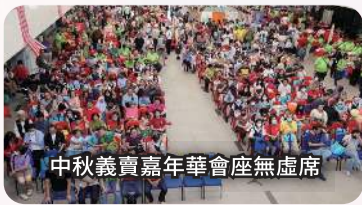
中秋義賣嘉年華會座無虛席