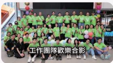
工作團隊歡樂合影