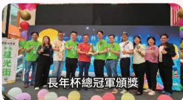
長年杯總冠軍頒獎