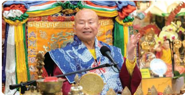
大黑天在西藏是大護法 在日本是財神 黑財神是財神也是護法 二者同體異名