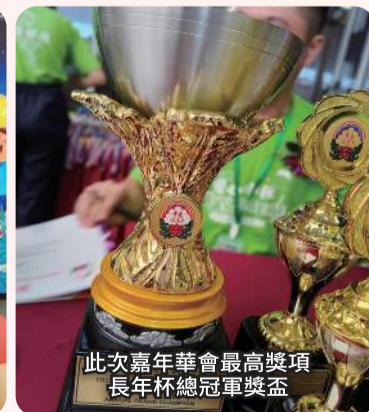
此次嘉年華會最高獎項長年杯總冠軍獎盃