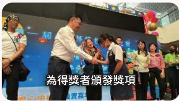
為得獎者頒發獎項