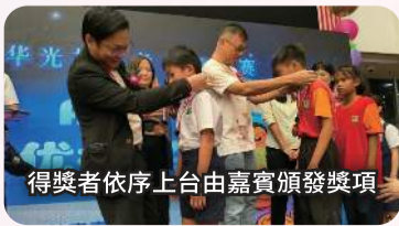
得獎者依序上台由嘉賓頒發獎項