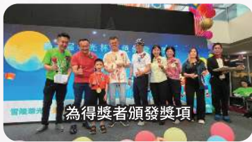
為得獎者頒發獎項