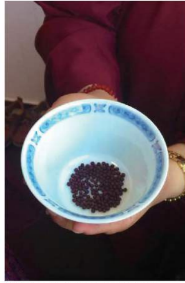
▲第十六世大宝法王的传承信物 [黑宝丸] 长出的小黑药丸。

王与胜彦初见面，法王却说一句：「我等你已经很久了。」就抱住他的头，两人头碰头，彷彿早已相识般。