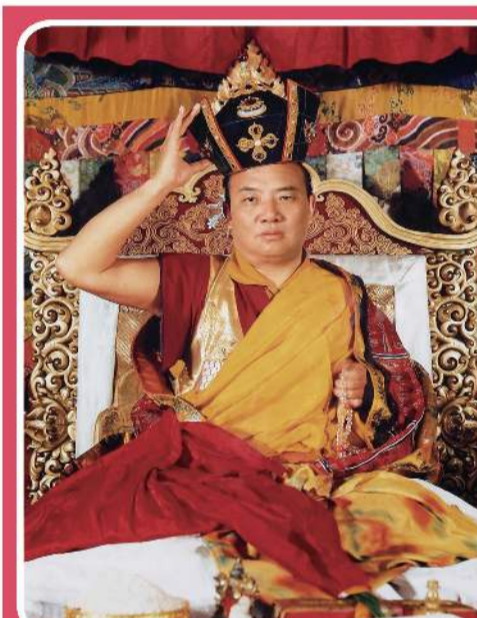
▲ 藏密白教的第十六世大宝法王噶玛巴。

跑遍全美国的大都市时，他发觉，西雅图是全美国大都市中最纯朴的城市之一，那里有自然曲折美丽的港口、有青翠而起伏的山丘；西雅图的夏天，有丝丝凉意的清晨，阳光如温柔的少女；西雅图空气的清新，是任何一个都市所不能比拟的。而西雅图市郊的西北地区，是一处安宁的地区，那里将是行走世界后，驻足的好地方。