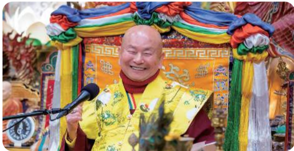
众香净土树下闻香 即获三昧功德具足 娑婆众生难调难化 佛陀演八万四千法