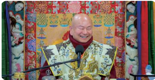
净土各有度众之法 一入佛国即不退转 三时系念功德无量 法王示现时时系念