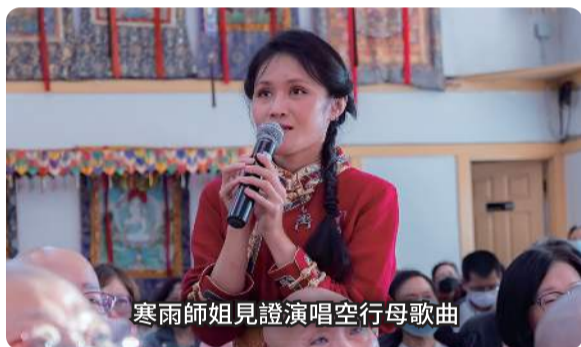
寒雨师姐見證演唱空行母歌曲

你是晚上一个人去吗？(对)那时候是几点(大概 9 点多吧) 9 点多还早，9 点多不会害怕，我经常就是 4 点多去，晚上 4 点多。这个很神秘，很神秘，她们空行母也一样有聚会所，聚会的地点，而且到了某一天，所有的空行母都要集合在一起，有地面的空行母，有在湖上的空行母，有虚空的空行母，有奥明天的十万空行母，友人间空行母，湖海里面的空行母，还有虚空的奥明天的空行母，她们能力都不一样。谢谢大家。嗡嗡呢咪咪。)