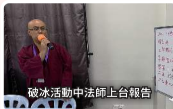
破冰活動中法師上台報告