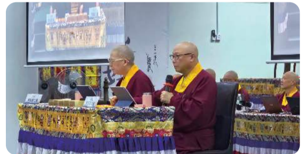
2024 宗委会与马密总联合举办 教育实体研习班 珍贵授课报导

周日的虚空藏菩萨法会,卢师尊再次向大家强调,修持虚空藏菩萨法,不仅能得到智能,还可以增强记忆,更可以得到功名,也就是考试第一。并强调在日蚀及月蚀的时候,修持此虚空藏菩萨法,更容易相应。卢师尊并特别再次介绍了空海大师的东密传承渊源,介绍密教如何流传到中土,再传至日本的过程,而空海大师的本尊就是虚空藏菩萨。更多卢师尊完整开示,敬请参阅本期真佛报。