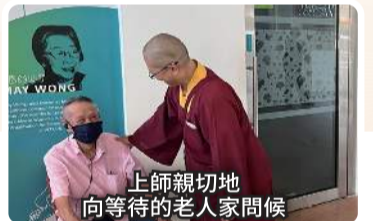
上師親切地向等待的老人家問候