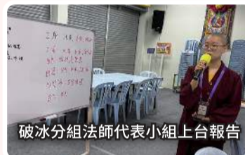
破冰分組法師代表小組上台報告