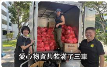
愛心物資共裝滿了三車