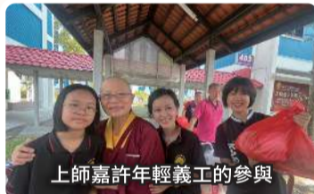
上師嘉許年輕義工的參與