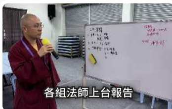
各組法師上台報告