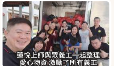
蓮悅上師與眾義工一起整理愛心物資激勵了所有義工