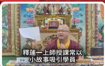
釋蓮一上師授課常以 小故事吸引學員