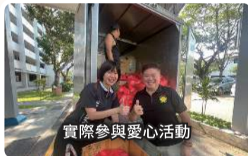
實際參與愛心活動