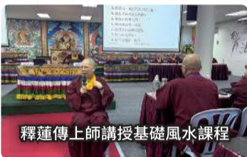
釋蓮傳上師講授基礎風水課程

此外还有重要的财库位、床位摆设等，又如根本上师每年赐福给弟子的招财吉祥物，经常就会收到同门询问，不知自家财库位在哪里？所以本次由长老教授基础的阳宅风水，是法师应当学习的知识，可以在有需要时帮助同门解惑。教育研习课程的第一堂课就如此实用，接下去的课程就更令人期待了。