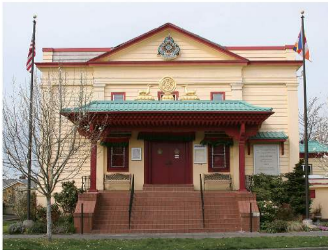
▲1974年，达钦仁波切与德松仁波切（Dezhung Rinpoche）共同成立了早先的佛法中心，名为萨迦·特钦·却林（Sakya Tegchen Choling；萨迦大乘法洲）。1984年，组织改组，更名为藏传佛教萨迦寺（Sakya Monastery of Tibetan Buddhism）。吉札·达钦法王将此萨迦寺竖立为在西方学习文化和宗教的道场。

由于萨迦证空上师嘱咐不要公开其真实身份，因此，胜彦向萨迦证空上师学法的过程，一直都保持低调。那时刚开始学会开车，他晚上藉口出去练车，其实是去求法，在社区里绕来绕去，然后绕到萨迦寺，萨迦证空上师就在那边等他。萨迦证空上师祂讲藏文，也会英文，然后懂一点华文，教喜金刚口诀时，胜彦听不清楚的地方，上师便叫一个懂得中文的宗萨仁波切在旁，把内容写下来，所以胜彦的书册上会注记著「萨迦证空大喇嘛明确的教示如下」。