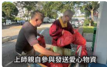
上師親自參與發送愛心物資