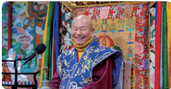
莲师同修 金母 师嬷菩萨 尼古玛齐现身 虚空藏具足智慧福德 日月蚀修法易相应

阿难又问:这种香饭也能够做佛事、也能够度众生?佛陀回复:确实是的。想知道佛陀到底讲述了多少佛土,多少不同的度众佛事呢?更多精彩开示,敬请参阅本期真佛报。