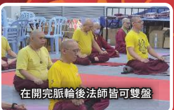
在開完脈輪後法師皆可雙盤