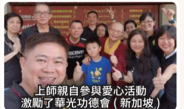
上師親自參與愛心活動激勵了華光功德會（新加坡）