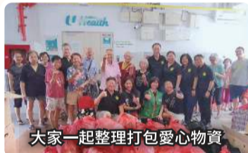
大家一起整理打包愛心物資