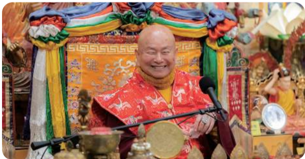
诸大弟子大菩萨 食众香饭香气不散 此饭如药 能消除烦恼诸毒化度有缘