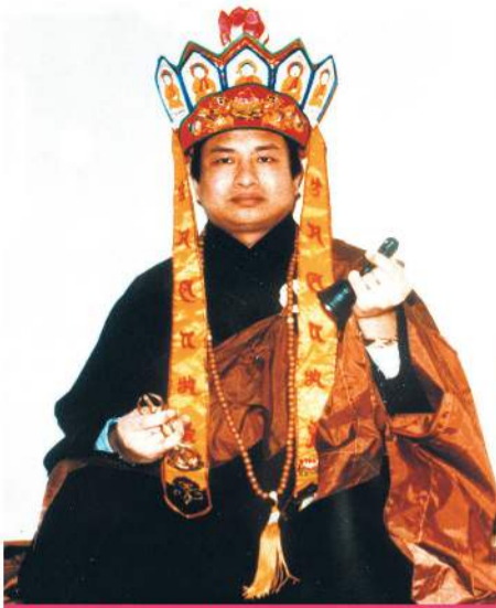
▲红冠冕金刚上师莲生尊者