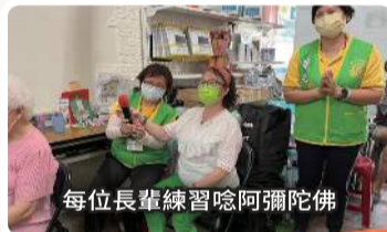
每位長輩練習唸阿彌陀佛