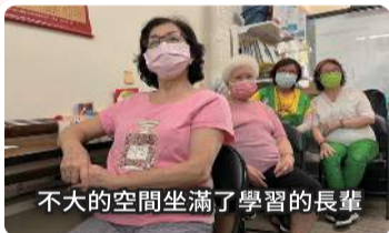
不大的空間坐滿了學習的長輩