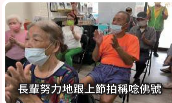
長輩努力地跟上節拍稱唸佛號