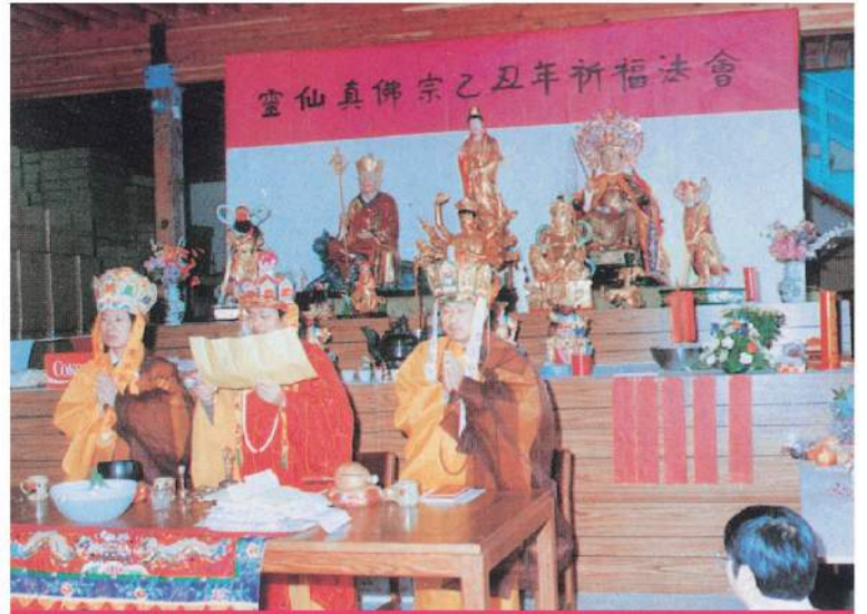
▲在Tukwila举办的第五次法会