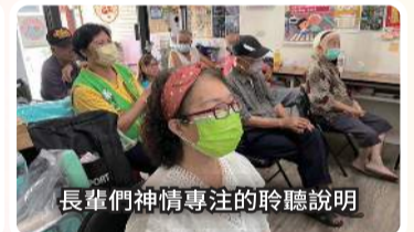
長輩們神情專注的聆聽說明