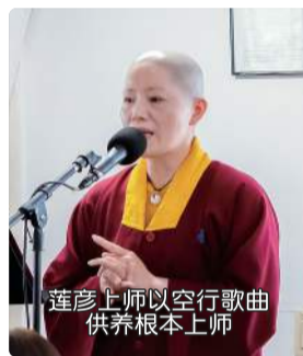
莲彦上师以空行歌曲 供养根本上师

还有吗？还有谁要唱？没有人要唱就…，有一位个子很高的，应该很会唱歌的吧，个子很高的是谁？个子很高的女生，会唱歌的那个个子很高的。你会唱吗？好，会唱起来，（香港师姐唱空行歌曲）。好啦，结束了。