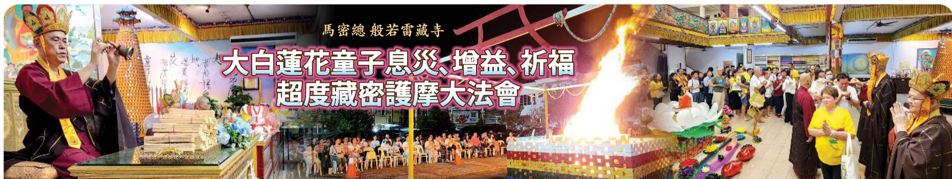
馬密總 般若雷藏寺