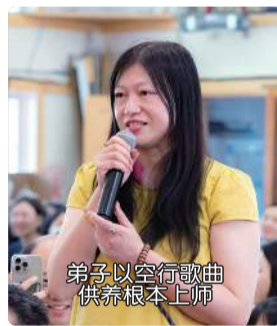
弟子以空行歌曲 供养根本上师