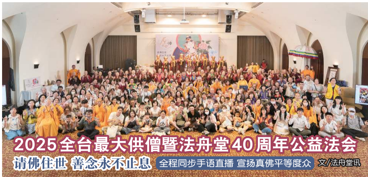
2025 全台最大供养僧暨法舟堂40周年公益法会 请佛住世 善念永不止息 全程同步手语直播 宣扬真佛平等度众 文/法舟堂讯