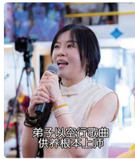
弟子以空行歌曲 供养根本上师