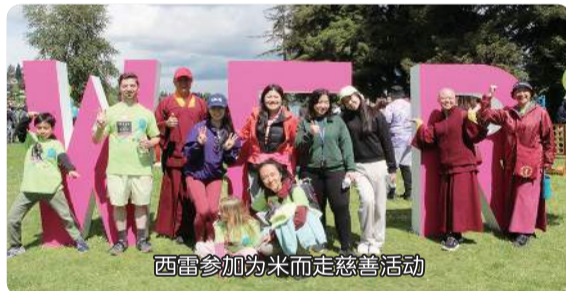
西雷参加为米而走慈善活动

符纸不是问题，符笔也不是问题，问题是你的身体(笑)，我是这样子认为的。我问问佛菩萨。符纸不是问题，现在越来越创新了，用米做的符纸。西雅图「Walk for Rice 为米而走」(慈善活动)，我们西雅图雷藏寺第一名(鼓掌)，「为米而走」第一名。