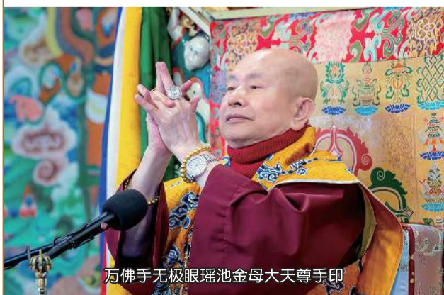
万佛手无极眼瑶池金母大天尊手印

祂的眼睛，可以开可以闭的。我一向不太愿意看祂的眼睛，因为看祂的眼睛，祂会射出一道冷光。祂跟这个印在纸上（法相），不一样的。在南山雅舍的，萤幕上面有，给祂放大一点，让大家看一看，那是南山雅舍的。对，祂的眼睛很特别，很