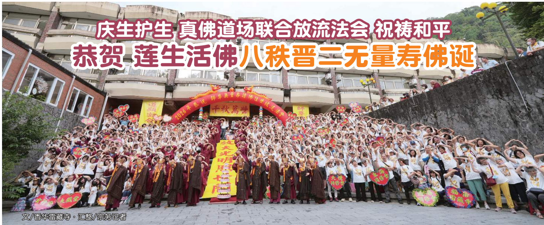
文/香华雷藏寺·汇整/宗务记者