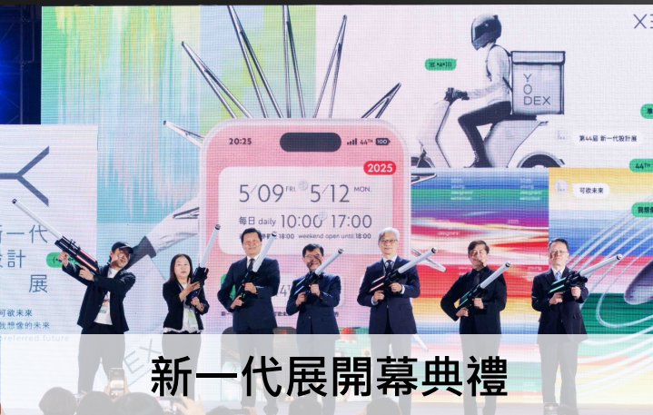
新一代展開幕典禮