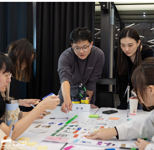
提前鎖定優秀人才