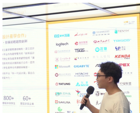
深入了解合作計畫

詳細說明專案資訊，從合作模式、資源配置到執行時程，全面解析專案內容並透過實例分享與成功案例，清楚了解參與優勢。