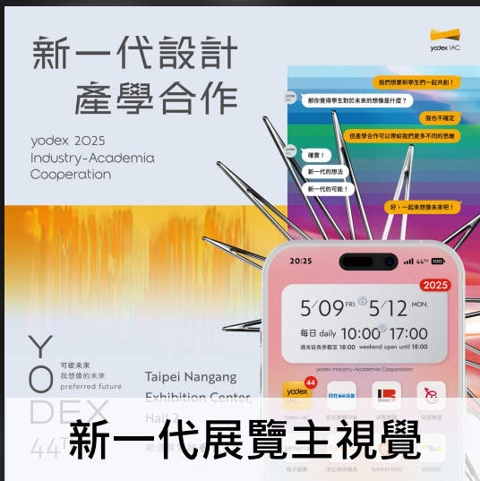
新一代展覽主視覺