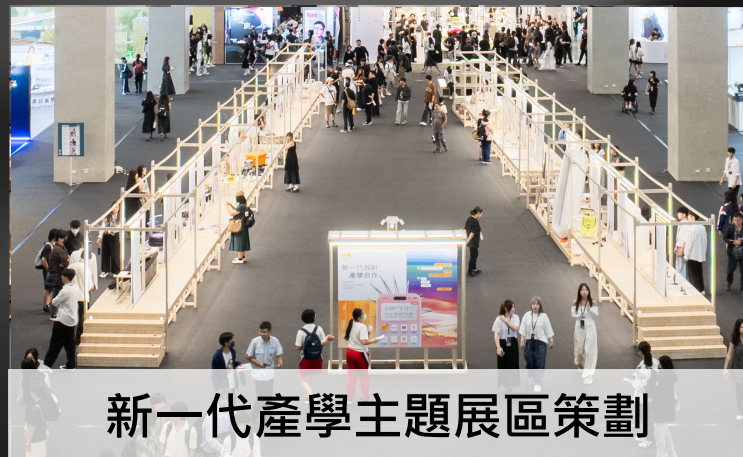
新一代產學主題展區策劃