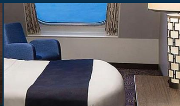
海景房：約 182 平方呎