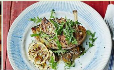
*Jamie's Italian：供應午晚餐，由名廚 Jamie Oliver 主理，打造正宗意式風味