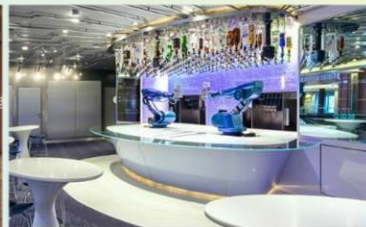
機器人酒吧：科技感十足的機器人酒吧，輕鬆下達指令，即可調製專屬特飲