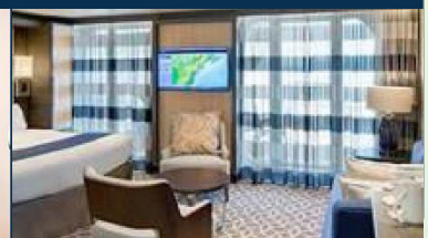
標準套房：連露台約 331 平方呎