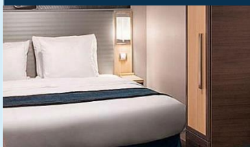
內艙房：約 166 平方呎