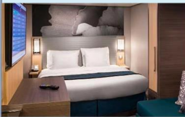
內艙房 (1V/2V/3V/4V)：166 平方呎