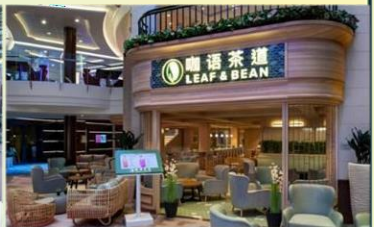
*咖語茶道：滿足各年齡層賓客，供應中國茶、咖啡等冷熱飲品，以及現烘中西式點心