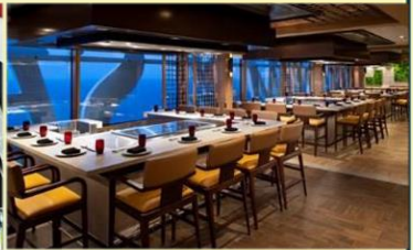
*日式鐵板燒：供應午晚餐，提供新鮮海產及頂級肉類，正宗日式美食應有盡有