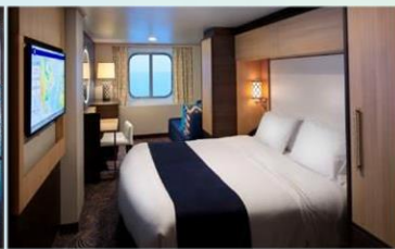
海景房 (1N/2N)：182 平方呎