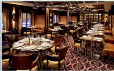
*美式扒房：供應午晚餐，品嚐傳統牛排餐廳的經典