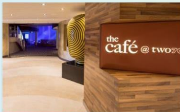
270度咖啡廳：供應早午餐，品嚐多款熱三文治、自選沙律及自家製濃湯