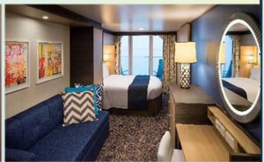
海景露台房 (1D/2D/3D/4D/5D)：198 平方呎