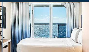
海景露台房：連露台約 253 平方呎