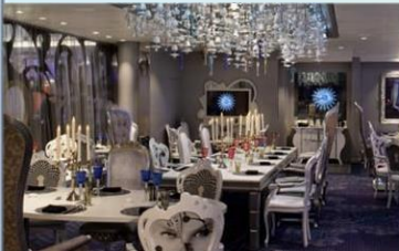
*大董意境坊：供應晚餐，與名店大董合作，體驗中國風的意境菜美食