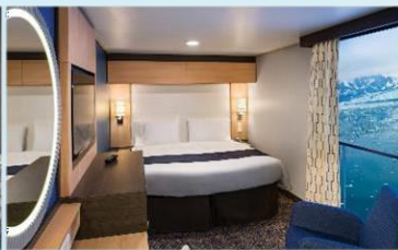
虛擬露台內艙房 (1U/2U)：166 平方呎