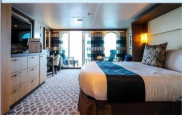
標準套房(海際套房系列) (J1/J4)：276 平方呎