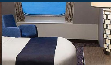
海景房：約 182 平方呎