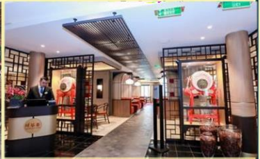
*川香：供應午晚餐，品嚐正宗川菜風味