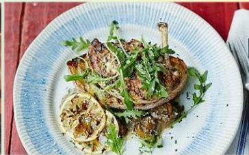
*Jamie's Italian：供應午晚餐，由名廚 Jamie Oliver 主理，打造正宗意式風味