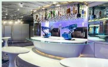
機器人酒吧：科技感十足的機器人酒吧，輕鬆下達指令，即可調製專屬特飲