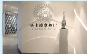
Sea Class 海際套房系列專屬餐廳