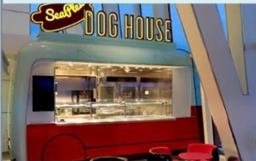
熱狗屋：品嚐不同風格的熱狗：紐約風格、芝加哥風格或你的個人風格。