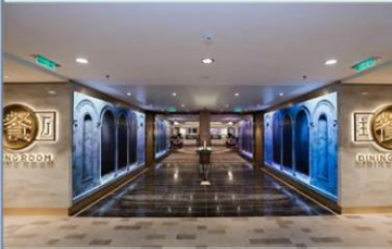
主餐廳：供應早午晚三餐的中西式美食