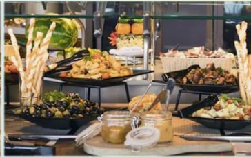
帆船美食廣場：供應早午晚三餐的環球美食自助餐