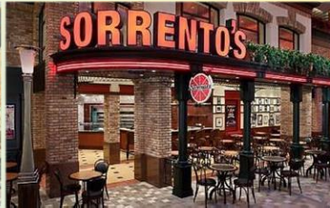
索倫托餐廳：供應午晚餐的意式 Pizza 美食