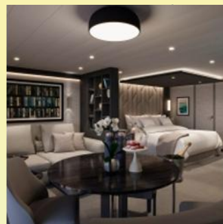
Deluxe Penthouse (Cabin + Terrace size: 584 sq. ft. + 150 sq. ft.)