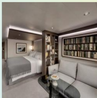
Ocean Grand Terrace Suite (Cabin + Terrace size: 418 sq. ft. + 118 sq. ft.)