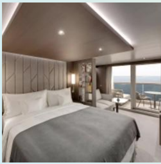
Ocean Terrace Suite (Cabin + Terrace size: 375 sq. ft. + 75 sq. ft.)