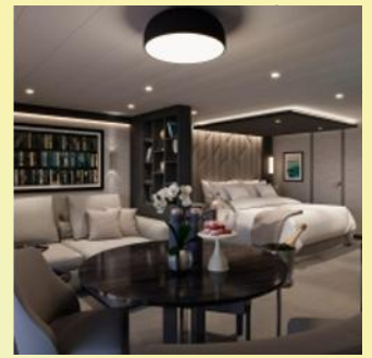
Deluxe Penthouse (Cabin + Terrace size: 584 sq. ft. + 150 sq. ft.)