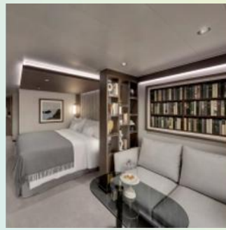
Ocean Grand Terrace Suite (Cabin + Terrace size: 418 sq. ft. + 118 sq. ft.)