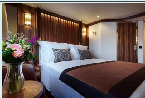
Panoramic Windows Cat E (Size: 161 sq. ft.)