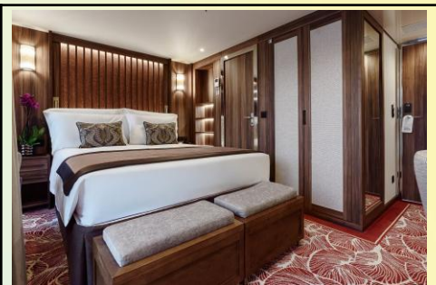
French and Outside Balcony Cat. B (Size: 215 sq. ft.)