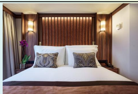
French Balcony Cat. C (Size: 161 sq. ft.)